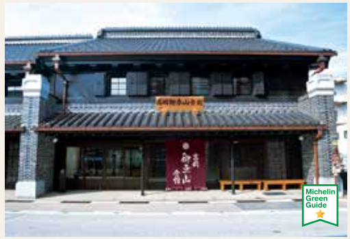
พิพิธภัณฑ์หาคาโอะคะ มิคุระยะยามะ