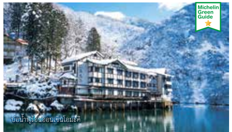
ป้อมน้ำพุร้อนออนเซ็นโอมะริ