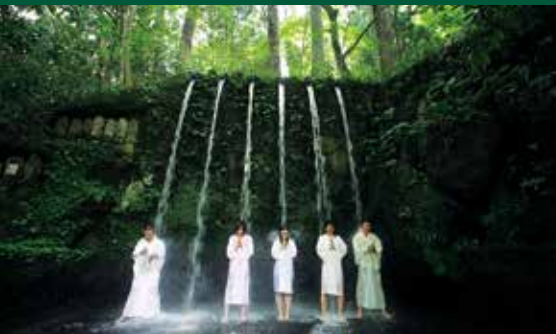
เปิดประสบการณ์ น้ำใสในน้ำตกที่วัดโออิระนิจูเซะคิจิ