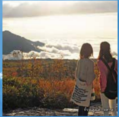
ที่ราบสูงมิดากะฮาระ