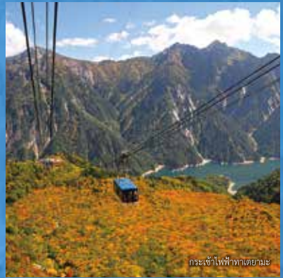
กระเช้าไฟฟ้าทาฮายะ