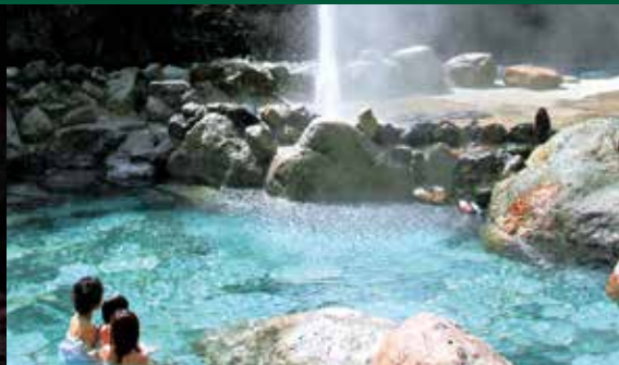
บ่อน้ำพุร้อนออนเซ็นคุโรนาจิ