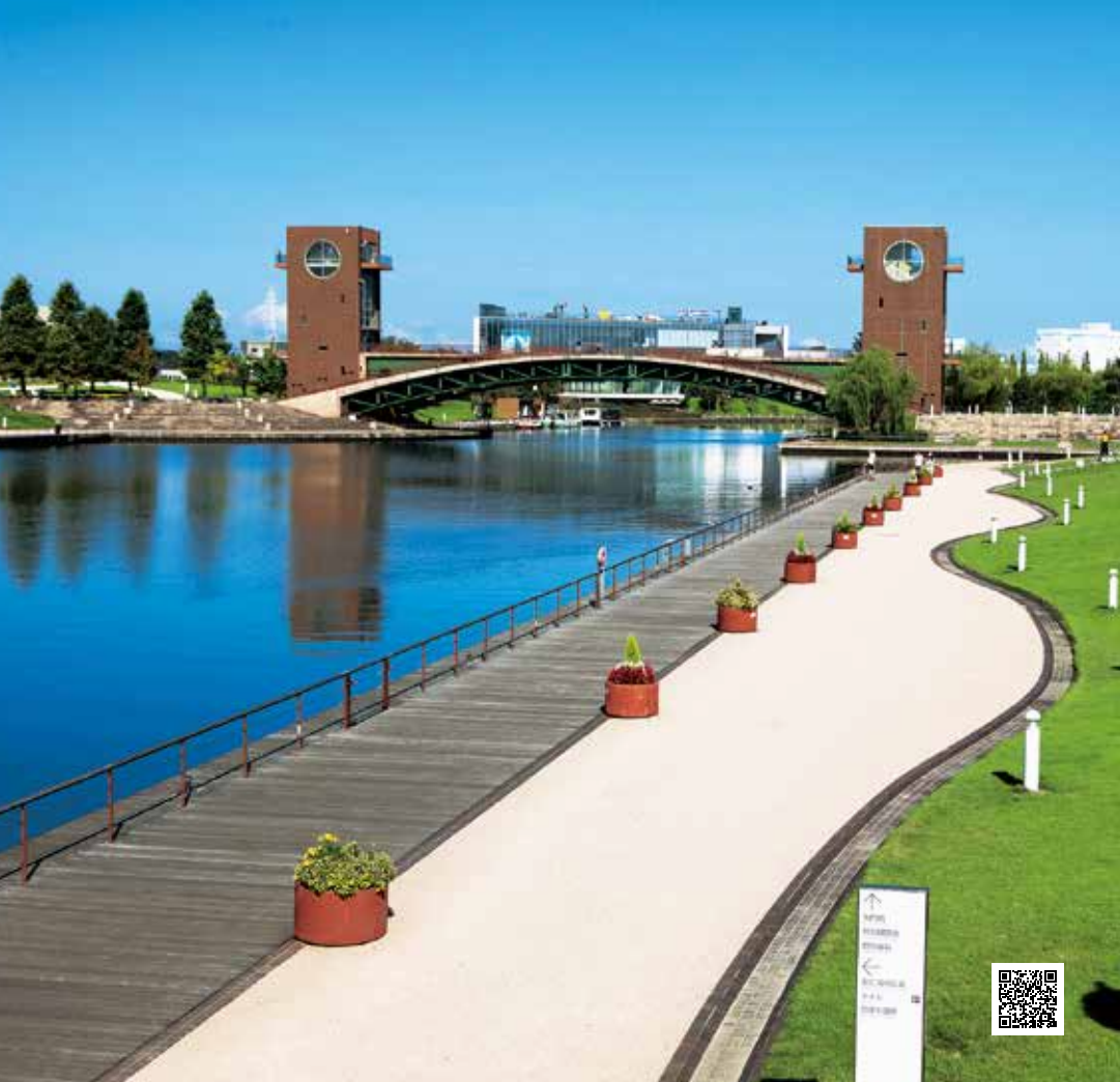
สวนสาธารณะฟุ่กัังอินกะคังซูย