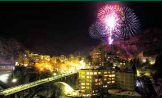
บ่อน้ำพุร้อนออนเซ็นอุมาซึคิ