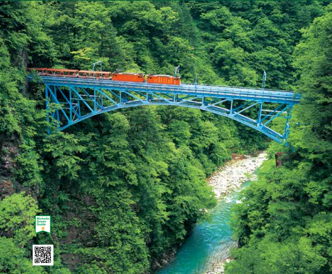
สะพานอะโตะบิติ