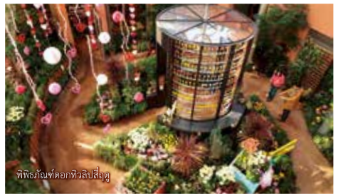
พิพิธภัณฑ์ดอกทิวลิปโตเกียว