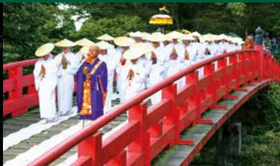
พิธีข้ามสะพานนุโนะบะชิ