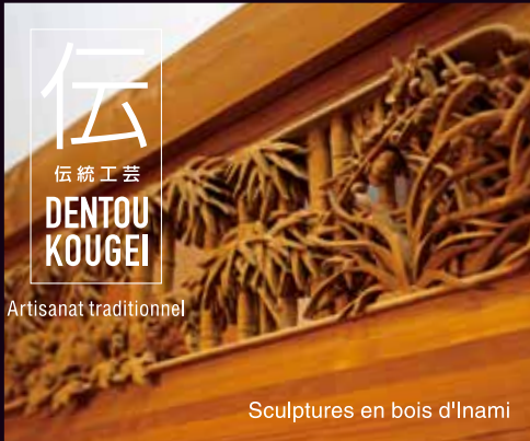
Sculptures en bois d'Inami