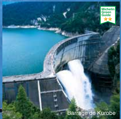
Barrage de Kurobe