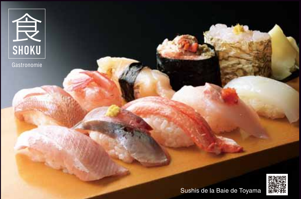
Sushis de la Baie de Toyama