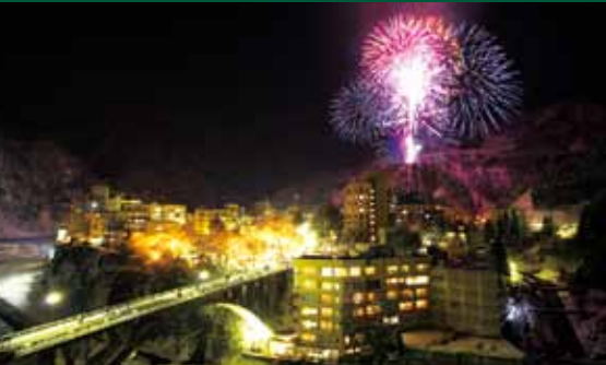
Source chaude d'Unazuki