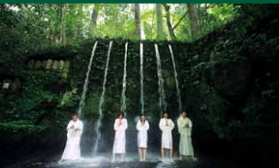
Expérience de méditation sous les cascades au temple Oiwa Nissekiji