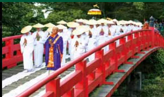
Cérémonie de Nunobashi Kanjoe