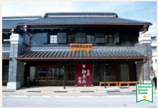
Musée Takaoka Mikurumayama