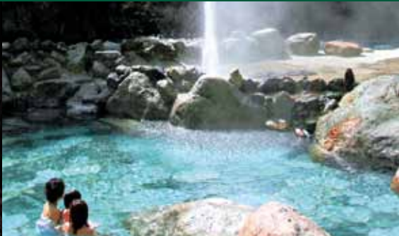
Source chaude de Kuronagi