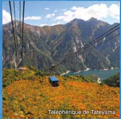
Téléphérique de Tateyama