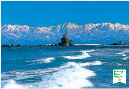
Parc quasi-national de la côte d'Amaharashi