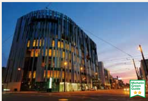
Musée d'art du verre de Toyama