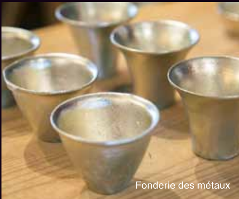
Fonderie des métaux