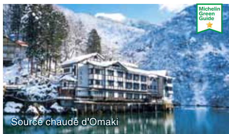
Source chaude d'Omaki