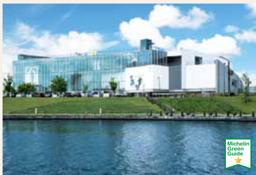
Musée préfectoral d'art et de design de Toyama