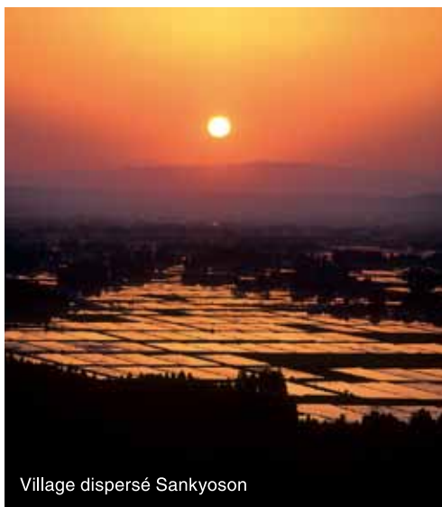
Village dispersé Sankyoson