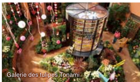
Galerie des tulipes Tonami