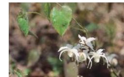
トキワイカリソウ