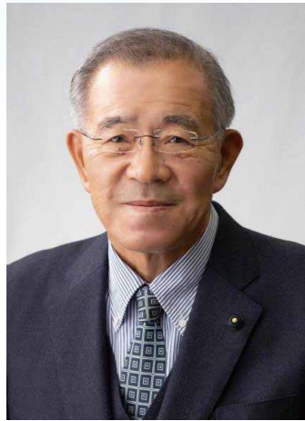
第133代 議長 筱岡 貞郎