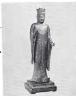
表紙説明 歴史シリーズ⑧ 立山神像

普通お盆といっている。その昔、釈迦の弟子目犍連が神通力で亡母の死後の姿を見たところ、餓餓道に落ちてさかさづりの苦を受けていたという。そこで釈迦にその救出法をたずねると釈迦は「毎年七月十五日に僧団に供養することだ」と教えられこの教えを守り亡母を餓餓から脱出させた