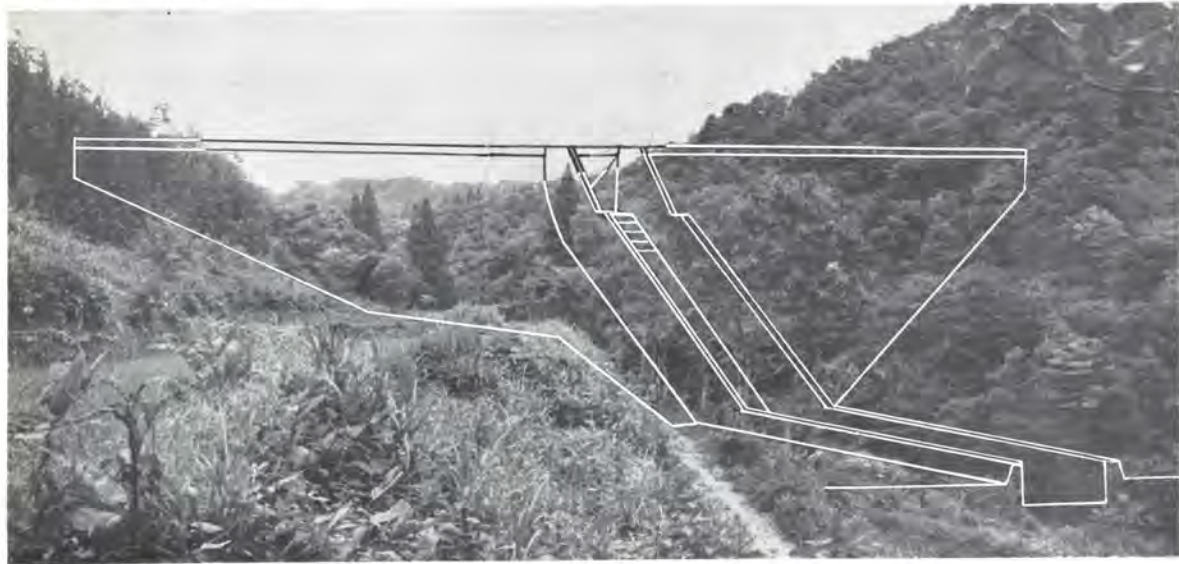
ダム建設予定地(小矢部市森屋地内)