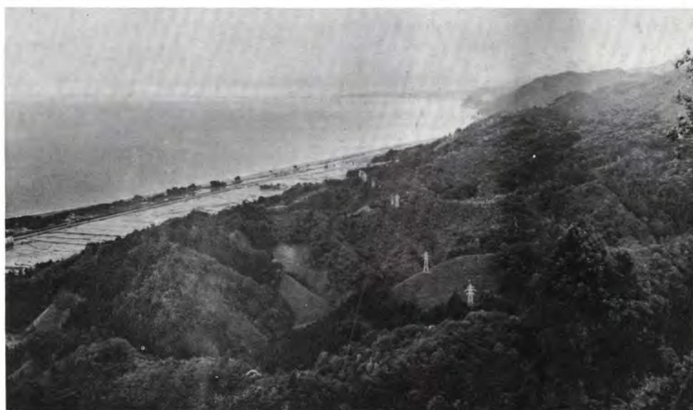
城山から宮崎海岸を望む

本県の東の端、北アルプスが日本海に没するとともに、眺望の城山、植物の鹿島樹叢、タラ汁、灰付ワカメで知られる宮崎海岸、浜山玉造りの遺跡などがある。