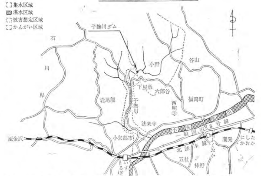
子撫川多目的ダム概要図

にかかりました。県の小矢部土木事務所に、子撫川ダム調査係を新設してこの調査にあたっています。ことしはダム計画に必要な地形、地質、水理等の調査を重点にすすめています。この地域は住民の方は農業収入による生計の依存度が高い反面、子撫川の流域に広がる耕地面積は割合に少なく、その