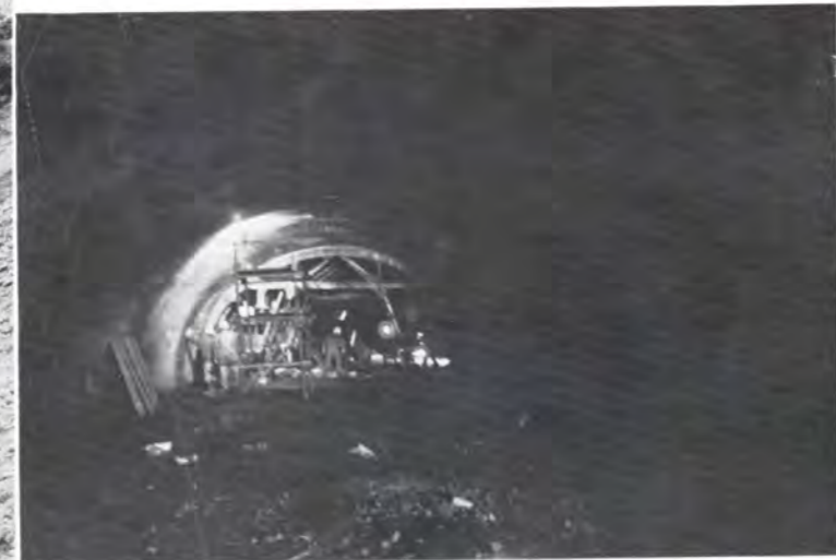
トンネルのコンクリート作業

「車のままで雲上へ」という夢が実現しようとしています。立山黒部観光ルートの一環として進められている桂台、美女平間(五、四九一崘)一般道路建設工事は、七月中旬には一応工事用車両が通行可能となりました。いまこころは、九月末の完成をめざして工事が急ピッチで進められています。