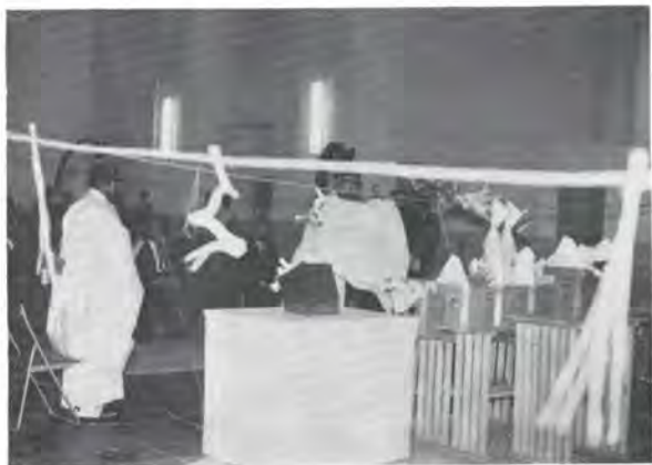
庄東第一発電所で行なわれた修抜式

和田川総合開発事業の主軸をなす和田川ダム及び庄東第一、第二発電所の竣工式が六月十八日、富山県民会館において行なわれました。 同事業は、庄川の水を和田川に分水して和田川ダム(砺波市増山)に貯え、これを発電、上水道、工業用水、かんがい用水にと、多目的に利用するもの。 ダムの完成により、臨海工業地帯への工業用水(日量最大三十万トン)その周辺地への上水道(同七万五千トン)、射水乾田化地区への農業用水の水源が確保されたことになりました。なお庄東第一、第二発電所の最大出力合計は三万一千四百瓩。