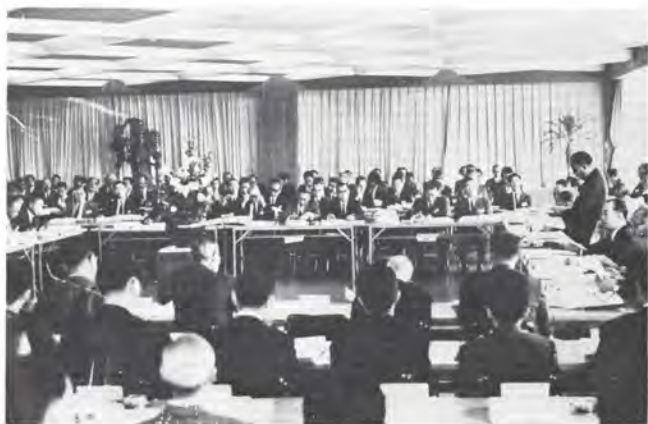
第四次県勢総合開発審議会総会