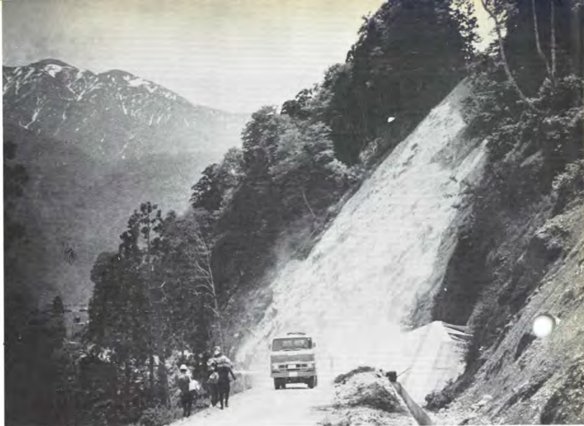
資材を積んだ工事用車両が通行可能に