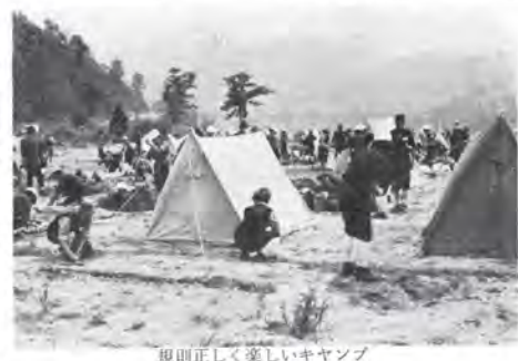
規則正しく楽しいキャンプ

ておきますと、生活態度がくずれたり、好ましくない生活習慣を身につけたり、ときには非行に走ることもあります。こどもの日々の生活を注意深く観察し、楽しさの中にも規律のある生活をおくられるよう指導したいものです。そのためには、優しい愛情の中にも厳しさが必要かと考えます。