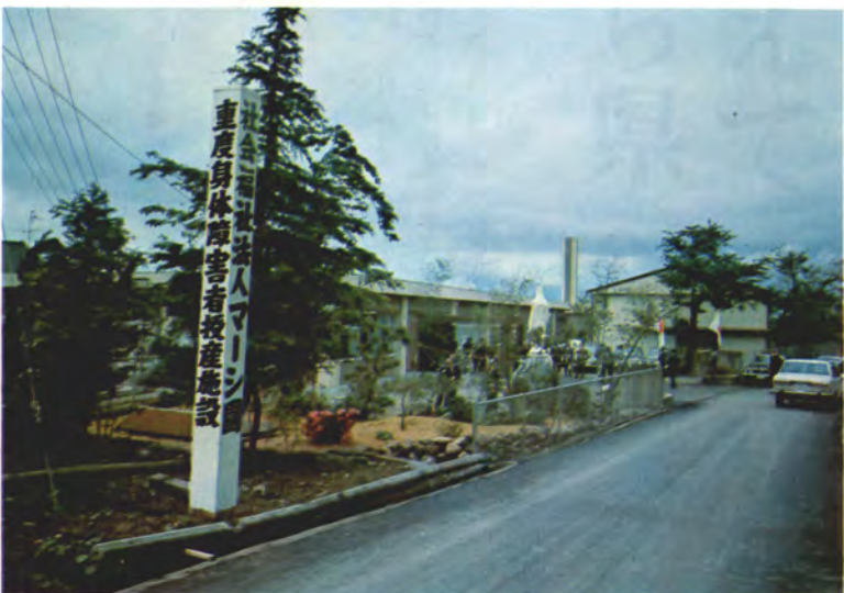
マーシ園が新しい場所に