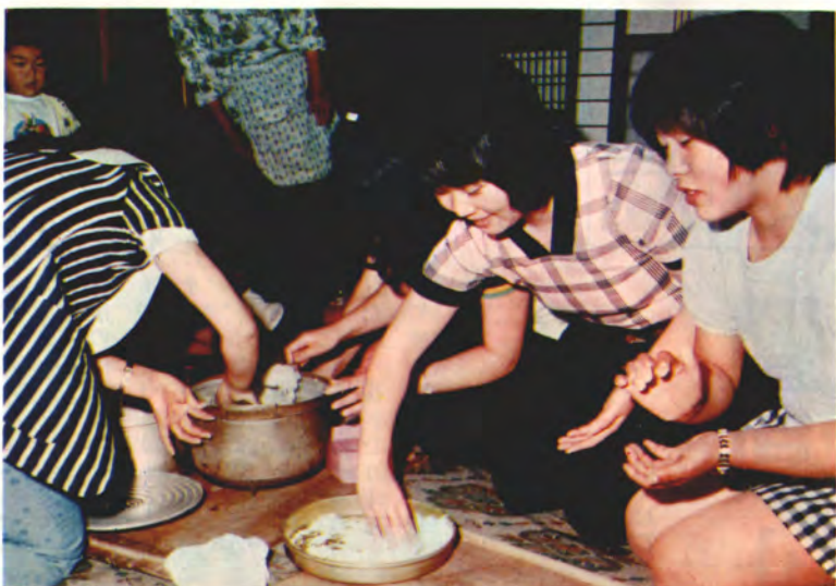
「ふるさとの家」でおはぎづくり