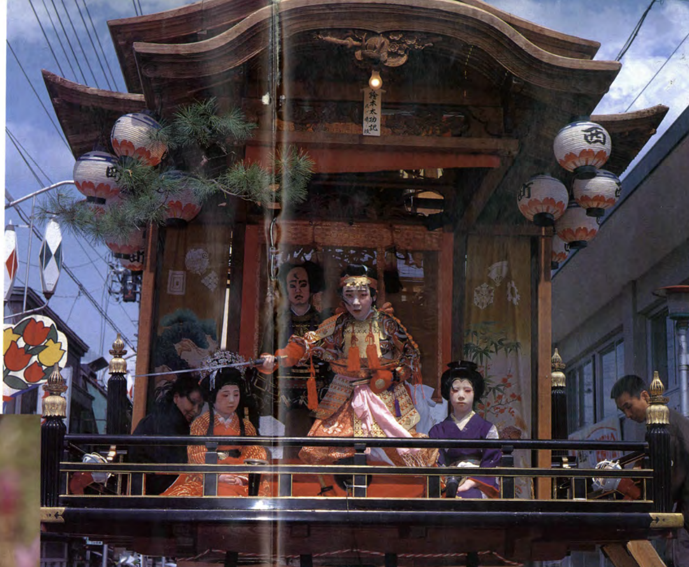
◀大人顔負けの演技を披露する子供役者