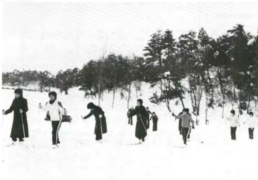
冬の自然を楽しみながら野山を散策できる歩くスキー