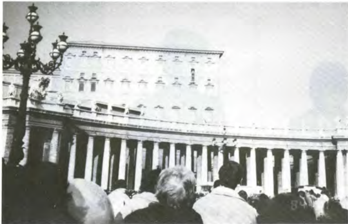
1月1日、ローマ法王の元旦ミサに出席