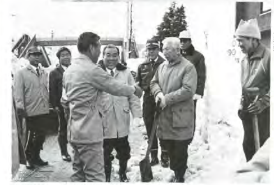
除雪状況を視察する稲村国土長官