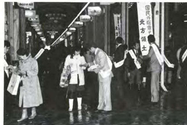
北方領土の早期返還を求め街頭キャンペーンを実施