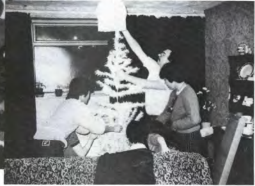
ホームステイでクリスマスの準備