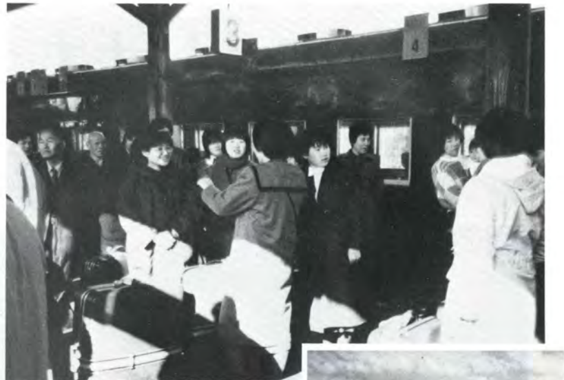
初めての海外体験に胸をはずませながら富山駅を出発