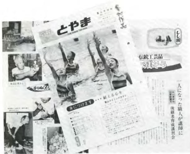
広報紙都市の部で特選に選ばれた「広報とやま」