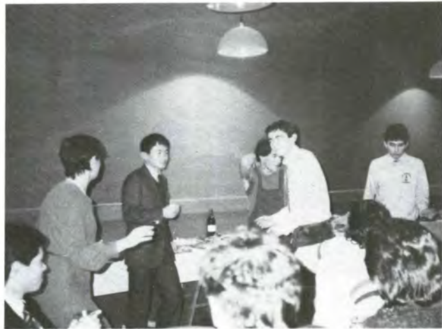
◀ホストファミリーや地元若者たちと楽しく交流 (プレストでのさよならパーティー)