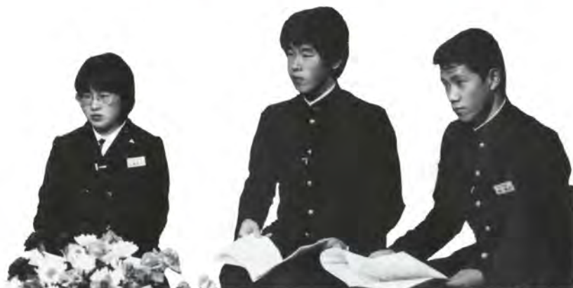
貴重な体験を生かしていきたいと語る団員たち