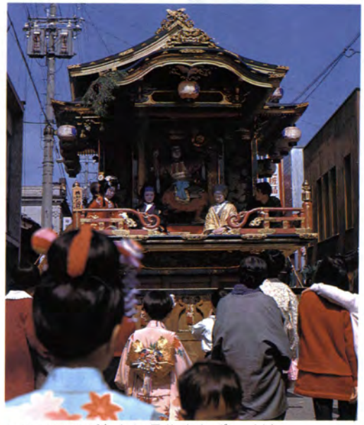
▲演技のみごとさに見物客もびっくり