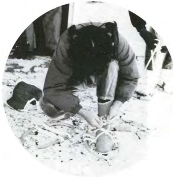
「私、「かんじき」って初めて」