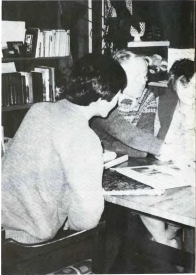
ホームステイで老夫婦からいろいろと話を聞く