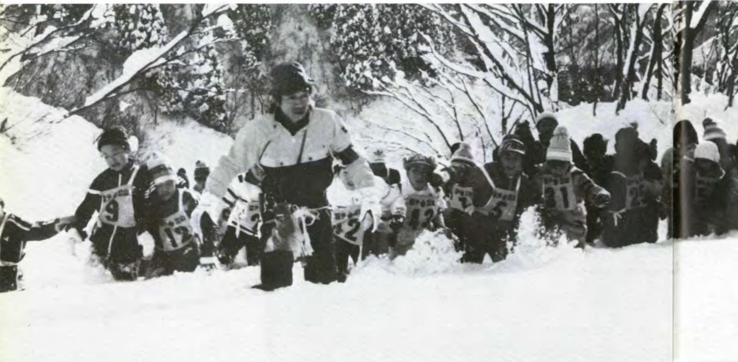
かんじき、をはけば数メートル積った雪の上でもらくらくと歩くことができる(国立立山少年自然の家)