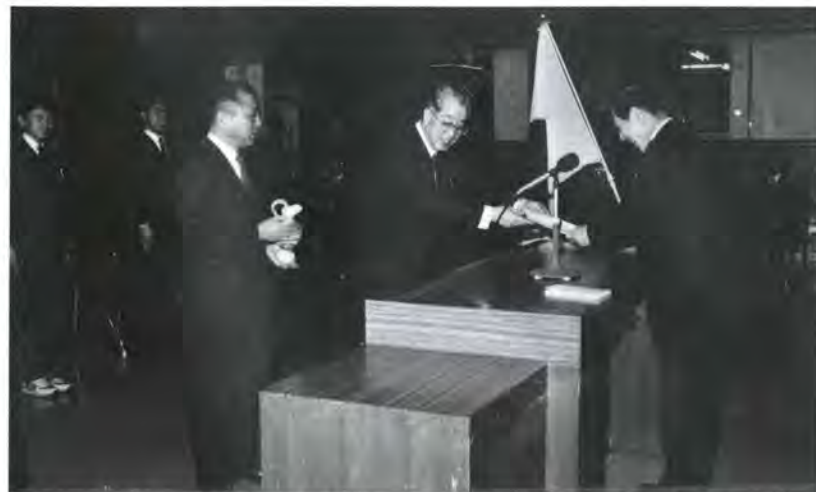
全員元気に帰県。解団式でプレスト市長からのメッセージを中沖知事に手渡す