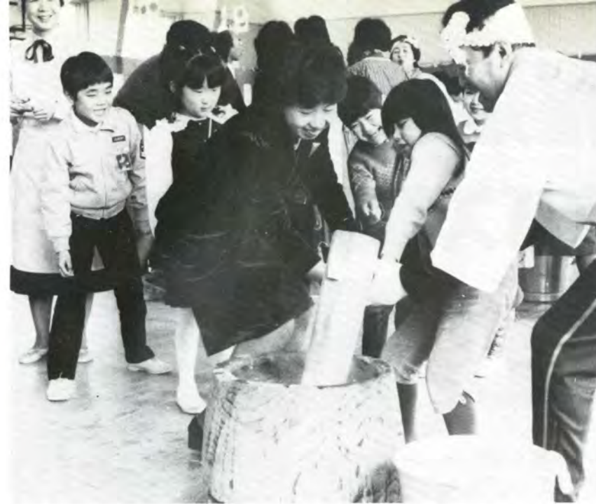
1枚写真(自由)の部で特選に選ばれた「キャーくつついちゃった」(富山市)