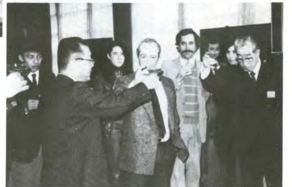
表敬訪問後のレセプションでは、国際交流についての話がはずむ