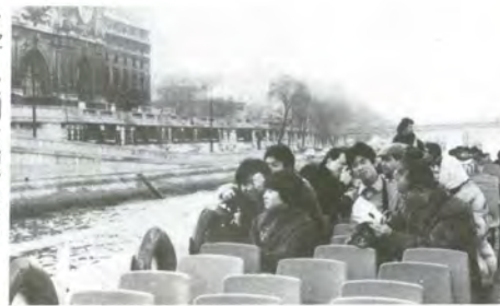
▶セーヌ川を船で遊覧