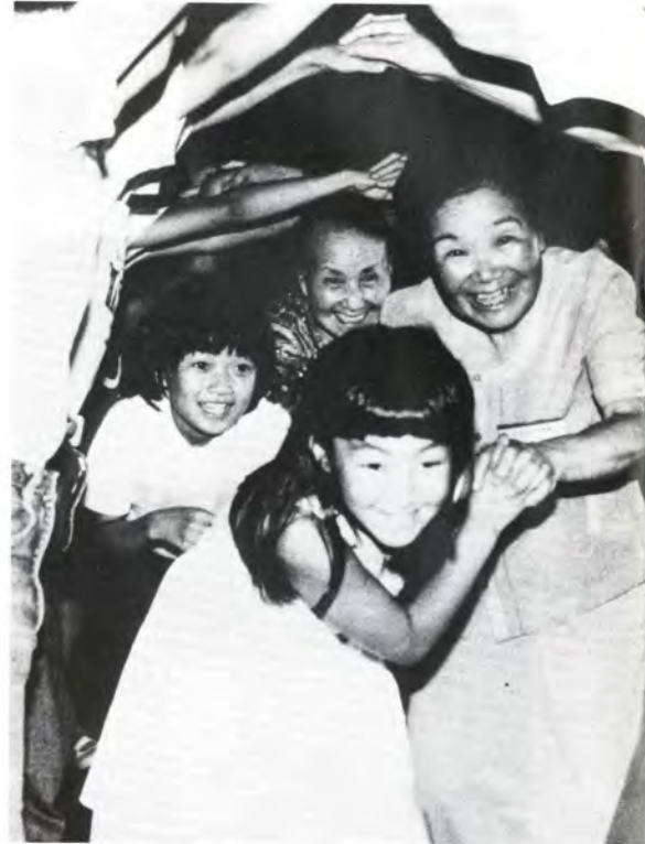
1枚写真(課題)の部で特選に選ばれた「おばあちゃんの手ってあったかい」(滑川市)