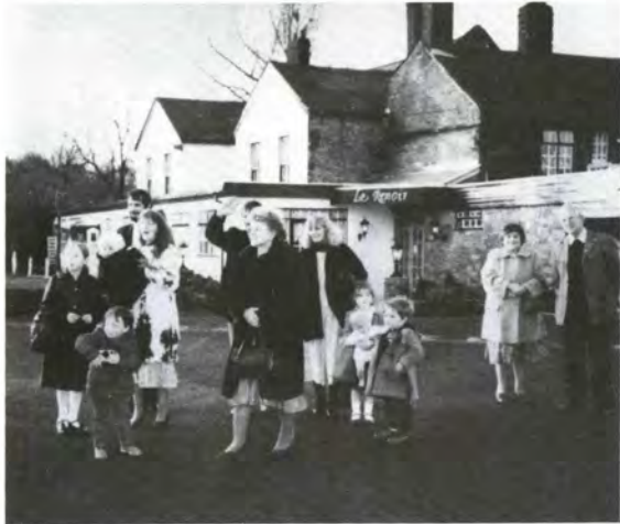
ホストファミリーに別れを告げ、フランスへ

建物の高さがそろう、それでいてそれぞれの建物の装飾が違うんです。 また、普通の建物にも芸術的なところがあるんです。 原 外国へ足を踏み入れたときには、写真でも見ているような