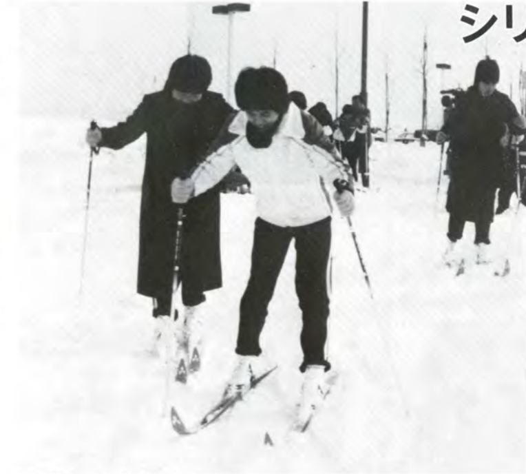
「歩くスキーも楽しいわね」