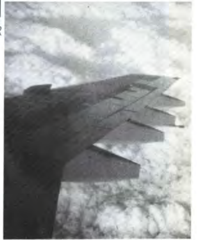
大阪国際空港から飛行機でロンドンへ