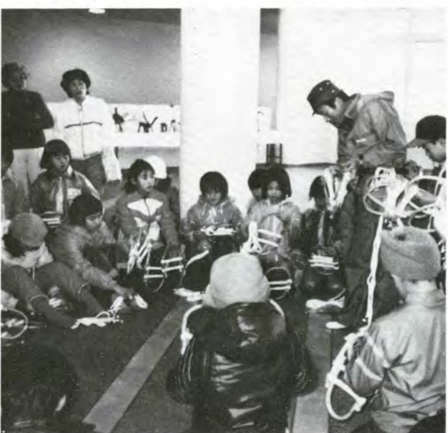
かんじき、のはきかたを教わる子供たち