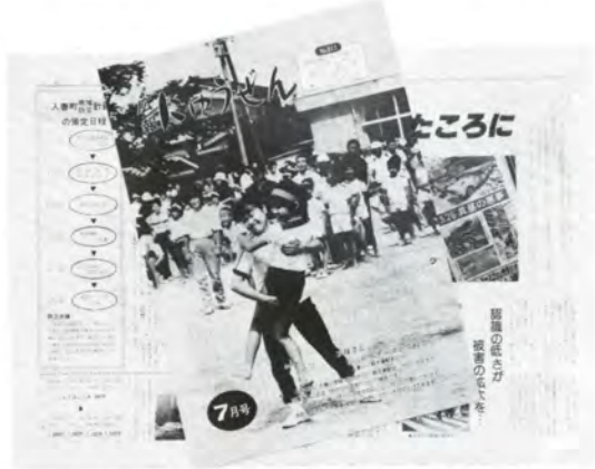
広報紙町村の部で特選に選ばれた「広報にゆうぜん」