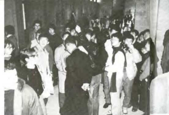
ルーブル美術館で有名な作品を見近に見て、そのすばらしさに驚く団員たち