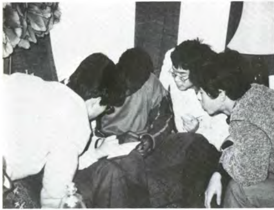
イギリスの黒人街を訪問し、黒人青年と親しく交歓