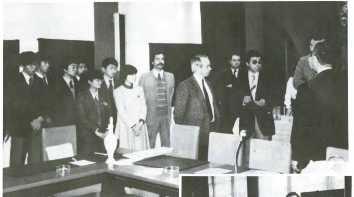
プレスト市を表敬訪問