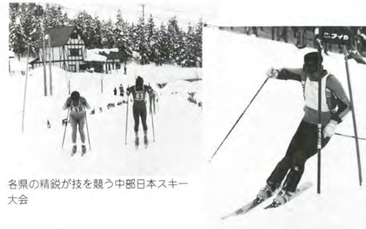
各県の精鋭が技を競う中部日本スキー大会