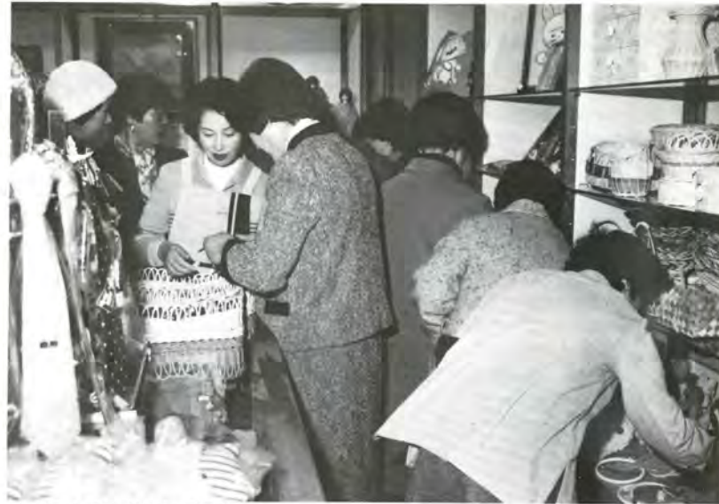
多くの人でにぎわう「福祉の店」

資本金は2億円で、三井金属51%、岐阜県19.6%、神岡町15.6%、富山県5.9%のほか、沿線の町村が出資。国鉄から新会社へ転換される10月1日から運行を開始する予定です。