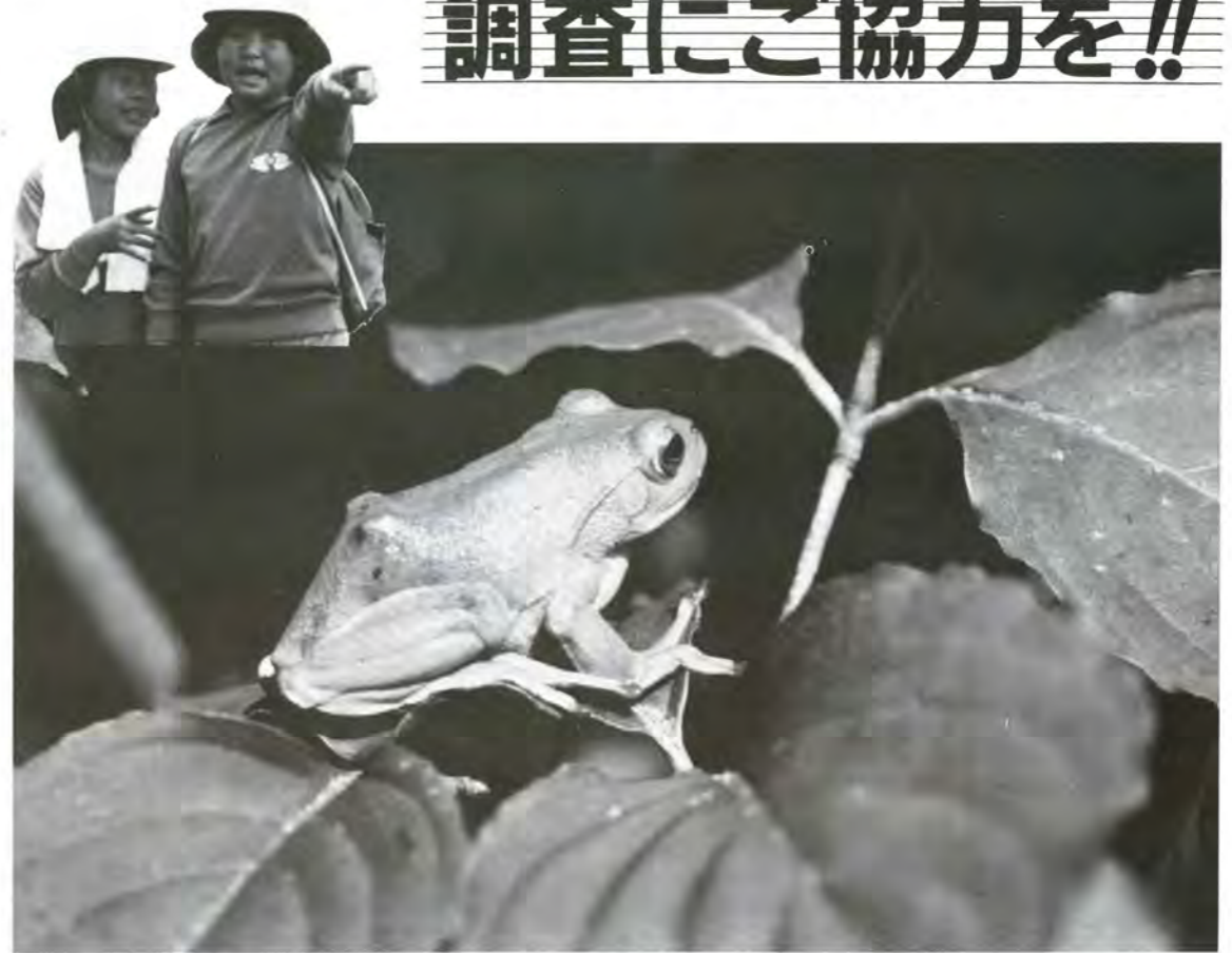
写真はモリアオガエル

『自然環境管理計画』をご存知ですか。 この計画は、県内一円の動物や植物、地形・地質、景観を調べ、これらの結果をもとに自然環境の重要性を数字で表わし、一平方メートルのメッシュ（碁盤目状の区画）で図化するものです。