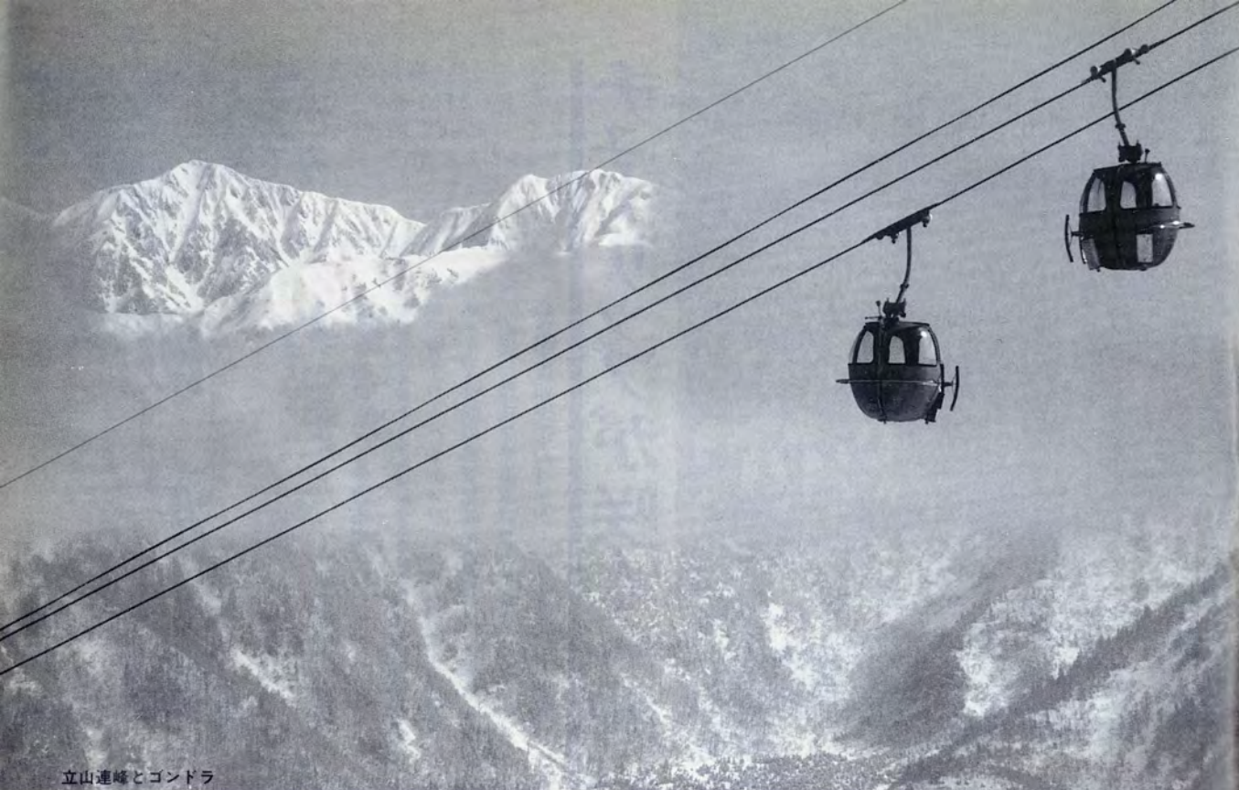
立山連峰とゴンドラ