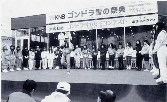
'89ゴンドラ雪の祭典

縫いぐるみスキーヤーとチビツ子の達とのジャンケン大会などが行われ、大勢の人でにぎわいました。今度の「ゴンドラ雪の祭典」では、雪の女王コンテストやスキー学校のインストラクターの壮大なたいまつ滑走が楽しめる他、前夜祭では、ティスコや生バンド演奏を楽しむことができます。