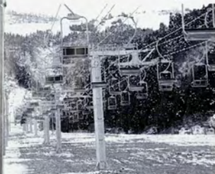
▲新しくきた第2ベアリフト

また、新たにベアリフトを二本設置し、輸送力を四倍にアップしました。さらに、ナイターコースを七五〇メートルに延長して、夜も魅力的なスキーが楽しめるよ