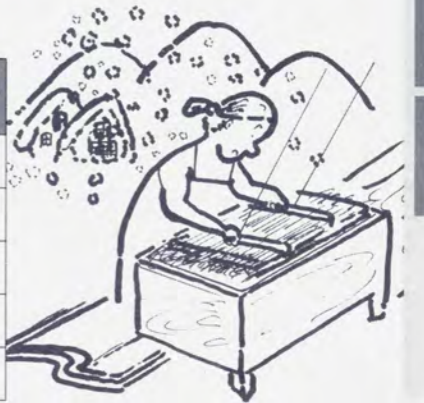
雪対策のすすみぐあい（主な指標）