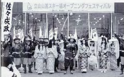
▲立山山麓スキー場オープニングフェスティバル

大きなイベントとしては、十二月の「オープニングフェスティバル」に続いて、この二月十七・十八日には、「ゴンドラ雪の祭典」を企画しています。ゴンドラ・極楽坂・あわすのスキー場が合同で開催した「オープニングフェスティバル」では、佐々成政の武者行列や山頂からのパラグライダー飛行