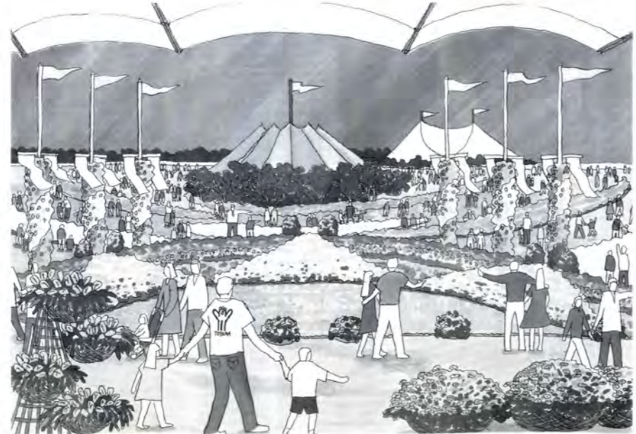
高岡おとぎの森公園会場のイメージ図

マスケットマーク 制作者 福田繁雄氏 (グラフィックデザイナー) マークは、元気いっばいの緑の発芽、若芽、開花などのイメージをシンプルなアイキャッチャーとして表わしています。 なお、愛称は、全国から応募があった1万通余りの中から問もなく決定されます。お楽しみに。