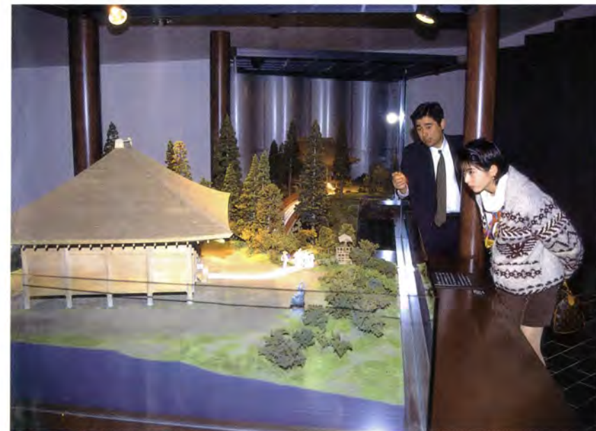
"布橋灌頂会"の模型展示