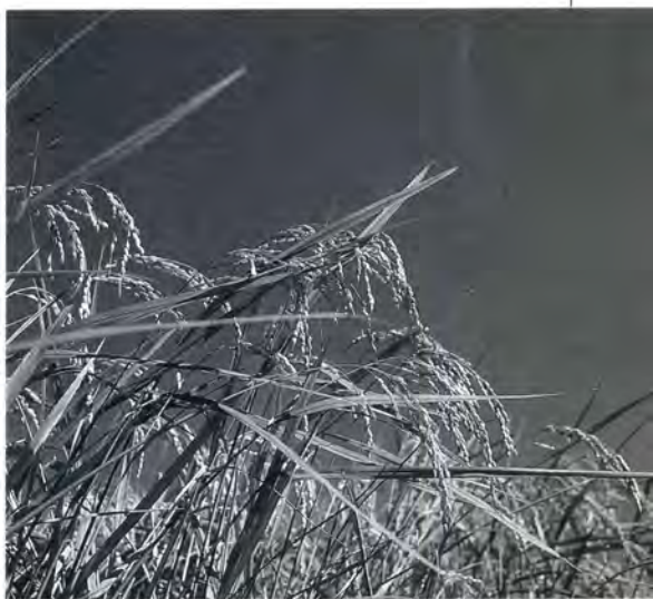
◀ヘルシーメニュー集 「おいしい和」