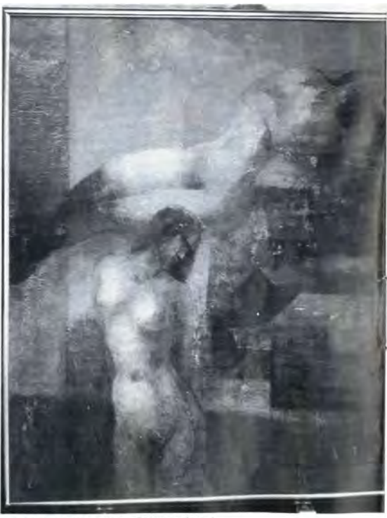
▲二科展特選の作品「記憶の中I」