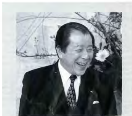
富山県知事 中沖 豊