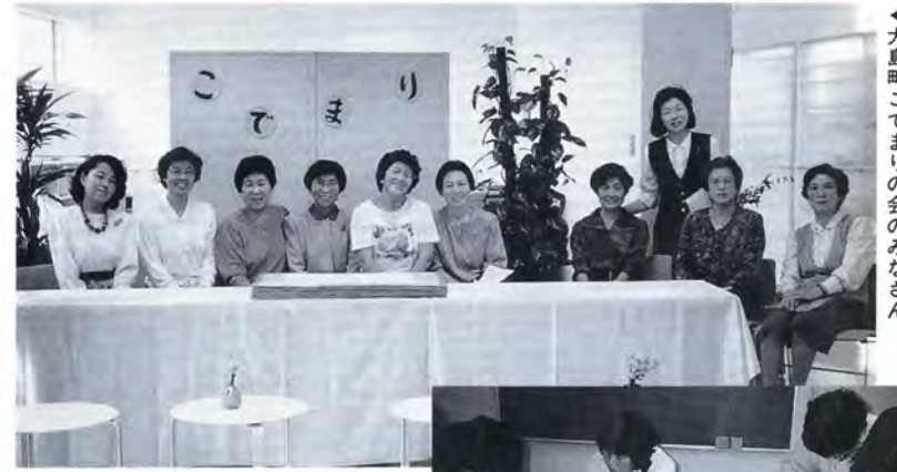
▲大島町こでまりの会のみなさん