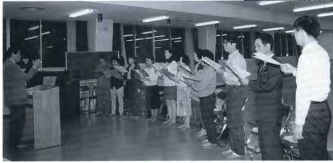
▲絵本コロ・アルカディアの練習風景