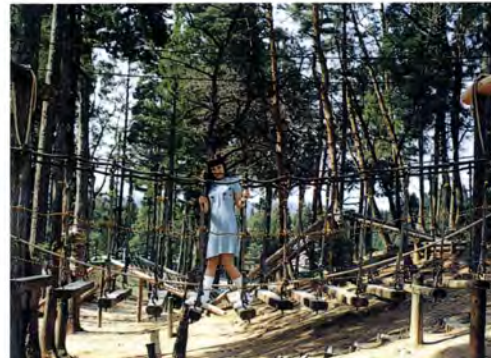
▲ 大自然の中でフィールドアスレチック