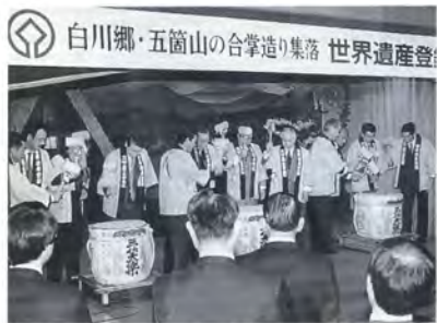
▲鏡開きで登録を祝う（上平村）

岐阜県白川村、白川郷の白川八幡宮に場所を移して行われた記念式典では、三集落の代表が「貴重な文化遺産を一致団結して継承していきたい」と決意表明。続いて、記念祝賀会が上平村の「ささら館」で開催され、世界遺産登録を契機に富山・岐阜両県共同で製作したハイビジョン映像を鑑賞した後、鏡開きで登録を祝いました。また、五箇山民謡保存会による民謡披露がお祝いムードに花を添えました。今後両県および三村が協力して、人類の遺産となった「合掌造り集落」の保全・継承に努めていきます。