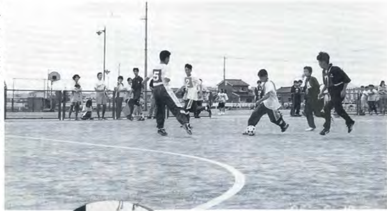
▶砂入り人工芝のフットサル場