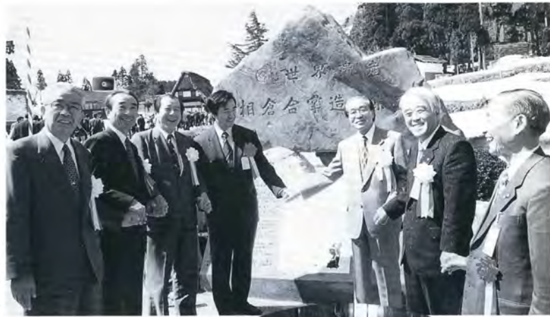
▲記念碑を囲んで協力を誓う（平村）

岐阜県白川村、白川郷の白川八幡宮に場所を移して行われた記念式典では、三集落の代表が「貴重な文化遺産を一致団結して継承していきたい」と決意表明。続いて、記念祝賀会が上平村の「ささら館」で開催され、世界遺産登録を契機に富山・岐阜両県共同で製作したハイビジョン映像を鑑賞した後、鏡開きで登録を祝いました。また、五箇山民謡保存会による民謡披露がお祝いムードに花を添えました。今後両県および三村が協力して、人類の遺産となった「合掌造り集落」の保全・継承に努めていきます。