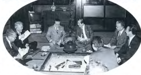
▲田舎裏を囲んでの世界文化遺産保全会議（平村）

昨年十二月にユネスコの世界遺産に登録された「白川郷・五箇山の合掌造り集落」の世界遺産登録記念式典が四月二十二日、平村、上平村、岐阜・白川村の三村をつないで行われました。