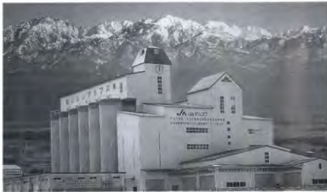
▲JAアルプス米地域連携型乾燥システム施設