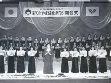
▲テーマソング「いつまでも」を合唱