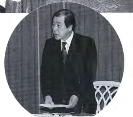
▲“地方集権”を強調する中沖知事