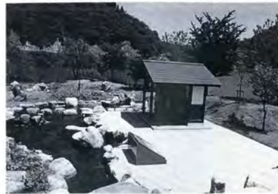
▼うるおいある水辺空間（福光町）