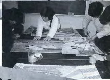
▲紙芝居の制作光景