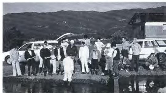
▲集落での現地指導

県では、若者等が定住しやすい条件とするための生活環境施設の整備等に対して支援を行っています。