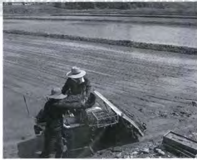
▼美味しい米づくりを目指した土づくり（堆肥散布）