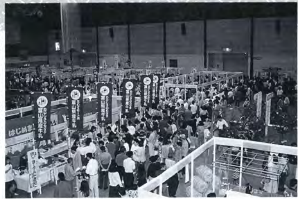
▶特産王国とやまフェスティバル