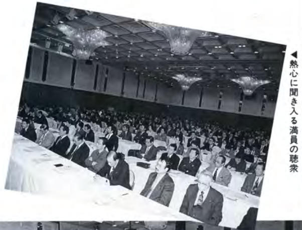
▲熱心に聞き入る議員の聴衆

政府の地方分権推進委員会の「一日地方分権委員会」が四月十九日、富山第一ホテルで県民ら約五百人を集めて行われました。