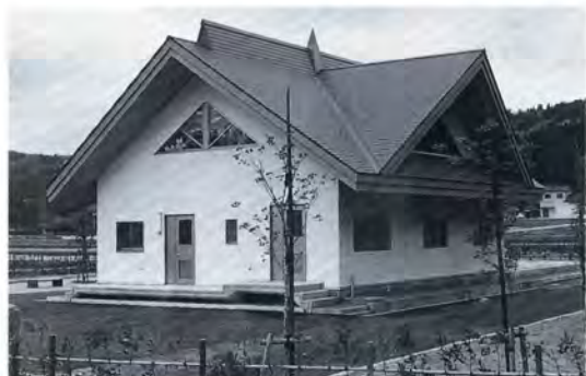
▲農業排水処理場（氷見市）

一方、山村地域においては、利賀村や立山町、上平村などで、集落道路や多目的広場、特産物の加工・販売施設等の整備を行っています。今年度からは、砺波市と庄川町にまたがる中山間地域を「とやま山麓地区」として、また、利賀村・平村及び上平村を「五箇山地区」として、都市と農村との交流、定住条件の整備、就業機会の確保など広域的な地域連携を図った事業を展開することになっています。