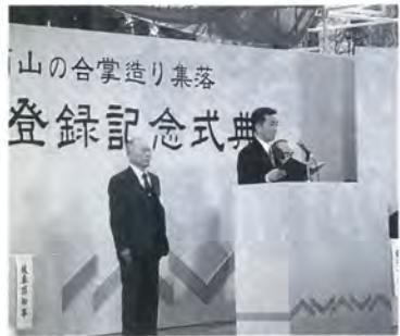
▲三村代表による決意表明（白川村）