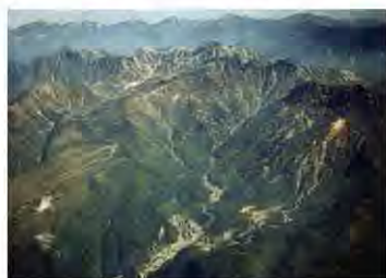
立山カルデラの鳥かん写真