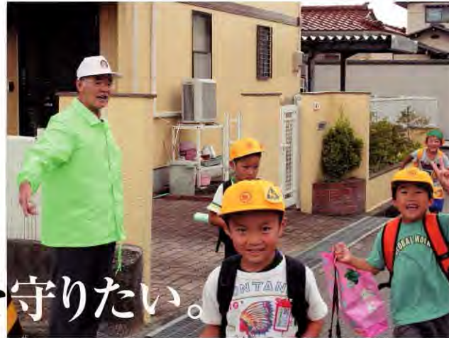
通学路の危険箇所などで見守りを行うパトロール隊