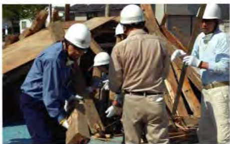
去る8月27日に行われた、県総合防災訓練における四ツ葉町自主防災組織の倒壊建物からの人命救助訓練

皆さんも、「自分たちの地域は自分たちで守る」という意識を持って、自主防災組織に参加し、地域に安心の輪を広げていきましょう。