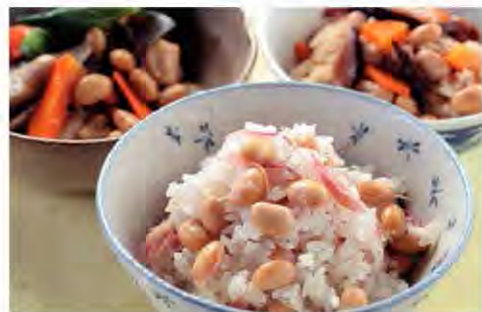
大豆と鶏肉のみそ煮(写真左奥)

富山の大豆はコシヒカリに並ぶ自慢の特産品。味の良さから煮豆、豆腐などの加工用にひっぱりだこで、「富山の大豆を使いたいが、なかなか手に入らない」という声も聞かれるほど。ごはんと一緒に炊き込んで、ふっくらおいしい大豆の味を満喫しましょう。