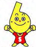
セーフティーくん (富山県安全なまちづくりマスコット)

住宅、住宅団地、道路・公園・駐車場、観光施設の防犯性の向上や、学校などでの児童らの安全確保を図る配慮事項を示す5つの指針を定め、10月1日から施行しています。この指針に基づき安全なまちづくりを進めていきます。