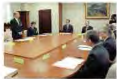
①公的病院長と意見交換し、同日、川崎厚生労働大臣に終末期医療のガイドラインや法整備に早急に取り組むよう要請した。