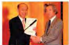
②小泉首相から「舞台芸術特区TOGA」の認定書を受けた。