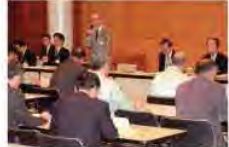
③南砺市でのツキノワグマによる人身被害を受け、各市町村の担当部長を集め緊急会議を開いた。