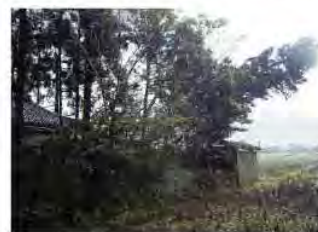
地域による新しいカイニヨの植樹(上) 台風で倒木したカイニヨ(下)