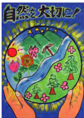
2005年度環境月間ポスター 小学生の部最優秀作品

◎「こどもエコクラブ」壁新聞 ◎「もったいないふるしき」ほか 県民の皆さまの参加をお待ちしています。なお、駐車場に限りがありますので、公共交通機関でお越しください。