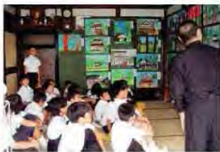
地元小学生が散居村を写生

●散居景観保全講演会を開催します。 となみ散居村ミュージアムの開館に併せ、記念講演会「環境新時代と、となみ散居村ミュージアム」を開催します。皆さんも、日本の農村景観を代表する「散居村」の未来と一緒に考えてみませんか。 日時：6月11日(日)10:00～11:30 会場：となみ散居村ミュージアム