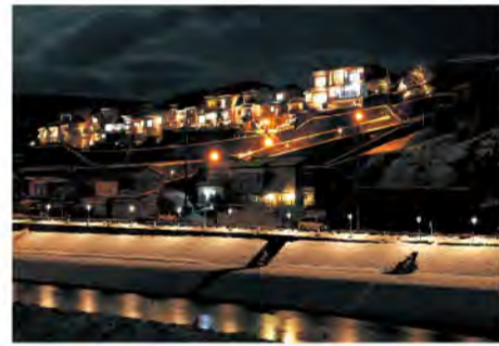
石垣に浮かぶ光の空中都市を思わせる「越中八尾夢あかり」

次代につなぐ とやま 未来遺産 vol.3 おわらが息づく 坂のまち、八尾 (富山市)