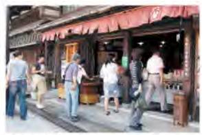
商店街でのスタンプラリー(南砺市井波)

中心市街地が活性化するためには、商店街が活気を取り戻すことが不可欠です。県では、商店街の魅力を高め集客力の向上を図る意欲的な取組みを市町村と連携して積極的に応援しています。