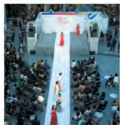
街なかグランフェスタ