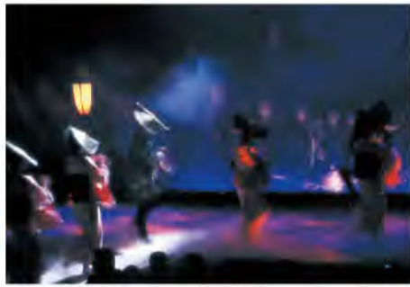
スクリーンに映された諏訪町を背景におわらを披露「越中八尾冬浪漫」