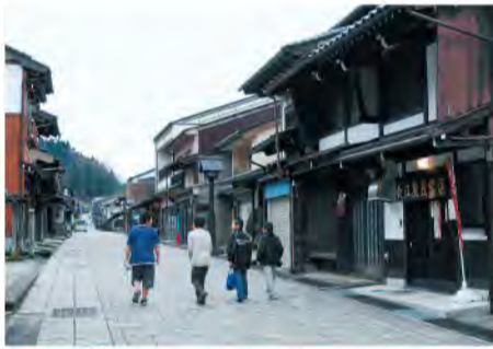
「日本の道百選」に選ばれた諏訪町本通り