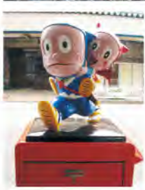
左/ハットリくんモニュメント(氷見市)