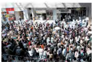
上/総曲輪フェリオ(オープン時)

平成19年2月、富山市が中心市街地活性化法に基づく基本計画の第1号として国から認定を受けたのに続き、11月には高岡市も認定を受けました。他の地域においても、中心市街地の賑わい創出に向け、地元の特徴を活かした意欲的な取組みが始まっています。県では、市町村や民間事業者等と連携、協力しながら、これらの取組みを支援します。