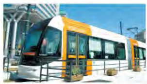
富山ライトレール

中心市街地へのアクセスの向上や中心市街地における回遊性の向上を図るため、路面電車やコミユニティバスなどの多様な公共交通の整備を進めます。