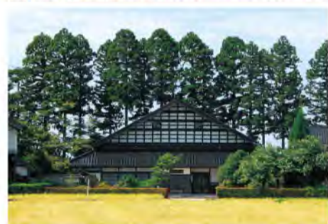
カイニヨに囲まれた伝統的なアスマダチの家