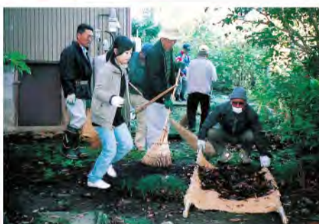
カイニヨ掃除の手伝い