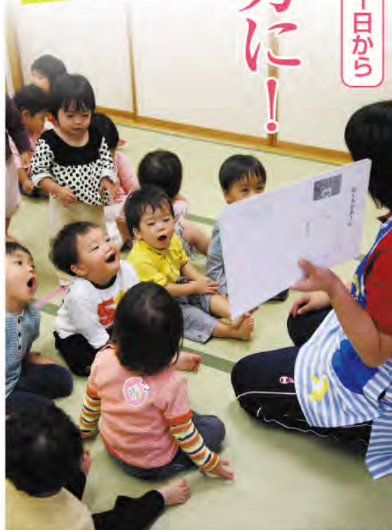
大広田保育所(富山市)

注意 ・通常保育料(延長保育等を含む)や医療費、物品購入(オムツやミルク代等)には利用できません。 ・「とやま子育て応援団」の協賛店での利用はできません。