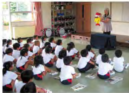
はじめてのエコライフ教室 幼稚園・保育所において、環境に関する紙芝居やクイズなどを行う教室を開催

県では、身近な10のエコライフの取組みを呼びかける「とやまエコライフ・アクト10宣言」キャンペーンを引き続き実施していきます。また、新たな事業として、幼児と保護者を対象にしたエコライフ教室の開催、映画館やスポーツイベント会場での飲料用リユースカップのモデル導入、エコドライブ推進大運動などに取り組んでいます。