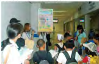
とやまエコキッズ探検隊