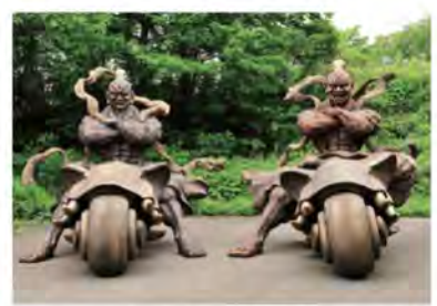
昨年の山王まつりで注目を集めた「象駆輪金剛力士座像」。筋骨隆々の勇姿は、高さ2m40cm、全長3m60cmで迫力満点