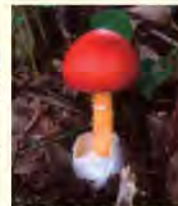
色が特徴的な食用のキノコ「タマゴタケ」

開催中～10月31日(日)まで 9:00～17:00 キノコの生態や利用方法等を展示。 10月9日から11日までは、県内で採集された生のキノコ(実物)も展示します。