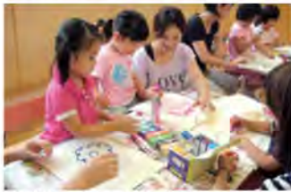
はじめてのエコライフ教室