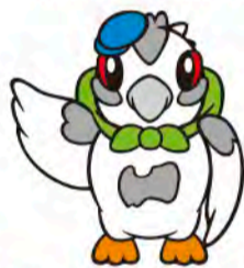
マスコットキャラクター らいとくん

お問合せ ▶ 第36回全国高等学校総合文化祭 富山県実行委員会(県教育委員会生涯学習・文化財室内) ☎076-444-8908 http://www.soubun2012.tym.ed.jp