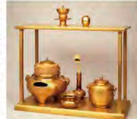
重要文化財 純金台子茶具 江戸時代

尾張徳川家伝来の美術品を所蔵する徳 川美術館。その中から大名文化の華とも 賞される、貴重な茶・香・ 能の道具類を一堂に紹 介。年月を経て洗練され てきた日本人の美意識を 探ります。