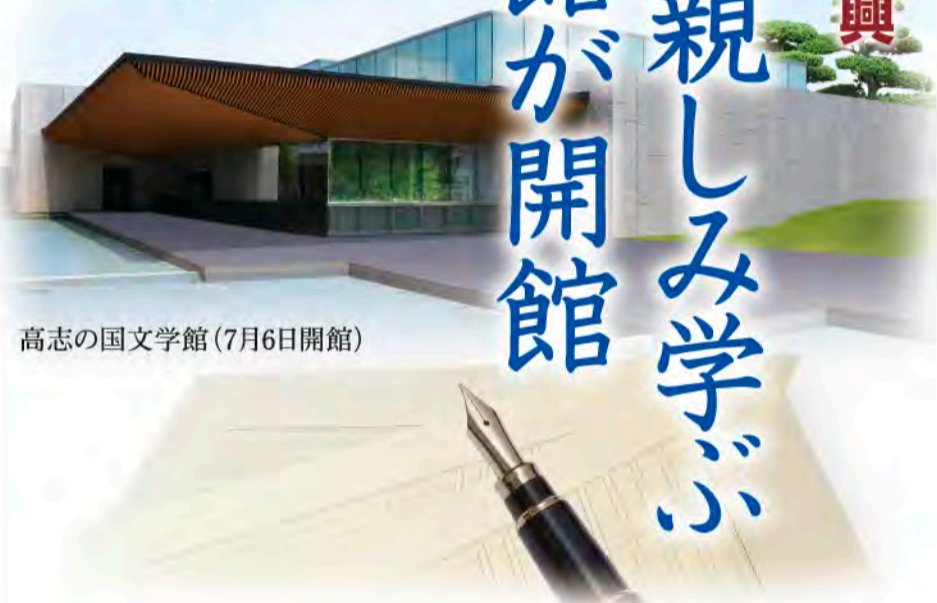
高志の国文学館(7月6日開館)

美しく豊かな自然や風土の中で育まれてきた 富山県ゆかりのふるさと文学。 その魅力を再認識し、継承、発展させていくため、 県では、7月に開館する高志の国文学館を活用し、 誰もが気軽にふるさと文学に親しみ学ぼうことができるよう取り組んでいきます。