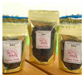
「ボッサの干しぶどう」 (黒部市・「ボッサファーム」)