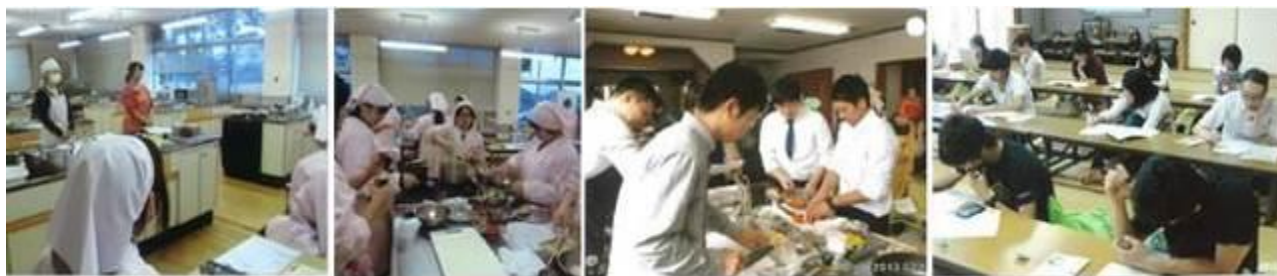
○若者世代に対する食育講座