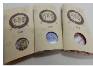
びしょくか 「美食花ソルト」 (南砺市・「千華園」)