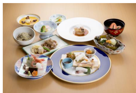
(冬の陣 「越中料理と地酒を楽しむ会」の料理)