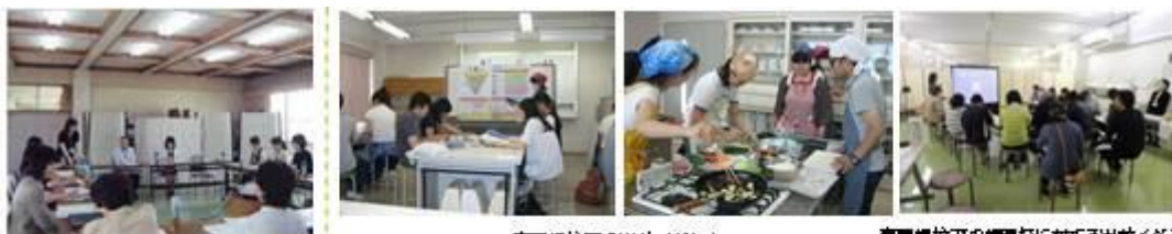
専門学校での出前イベント