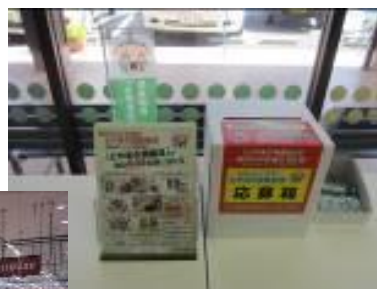
○サービスカウンターや売場での応募用紙・応募箱の設置