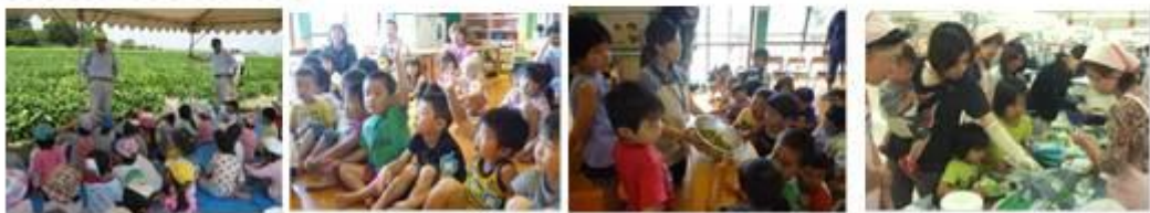
保育所での出前イベント