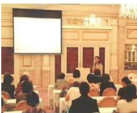
○食育リーダーによる食に関する研修会