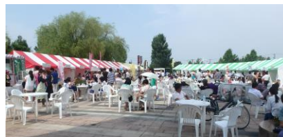
環水広場の賑わい風景