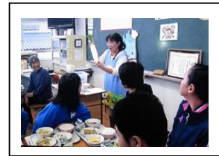
○会食時の栄養教諭の話し