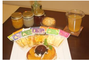
蜂蜜を活用したスイーツ等