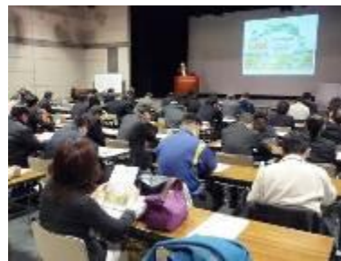
食品表示講習会の様子