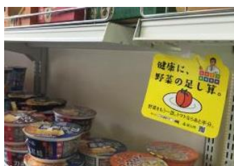
スーパーでの情報発信