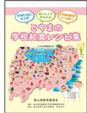
○学校給食レシピ集