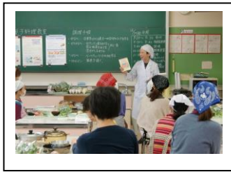
○栄養教諭による講義