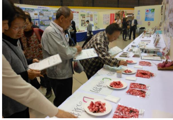
(新商品等の来場者アンケート)