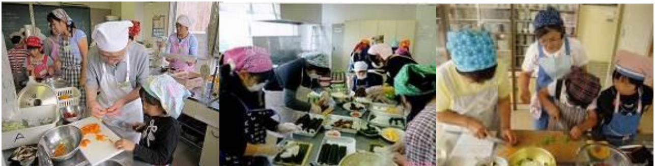
○三世代ふれあいクッキングセミナー（食改協）