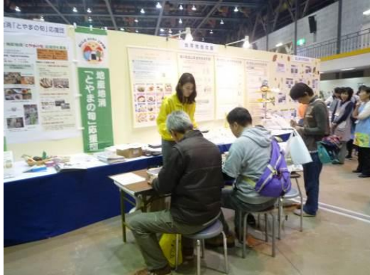
(「越中食の王国フェスタ 2015～秋の陣～」)