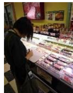
食品表示ウォッチャー