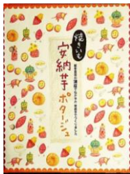
安納芋ポタージュ