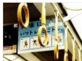
あいの風とやま鉄道社内での掲示