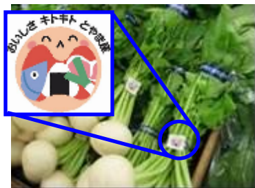
○県産品に貼られる地産地消シール

食品スーパーマーケット・百貨店、青果店、加工食品製造直売所（363店舗） 青果・鮮魚・精肉・加工食品に貼り付けてある「地産地消シール」 「プライ斯拉ベル」を10枚集めて応募