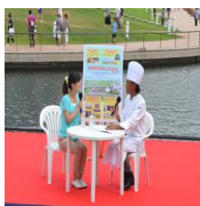
茂出木シェフのトークショー