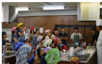
シェフによる料理説明とデモンストレーション

*翌日、自遊館にて「とやまの食」展示・商談会を開催し、首都圏等バイヤーに県産食材を紹介した。