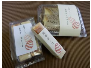
「里芋チーズケーキ」 (高岡市・「有オカジマ農産」)