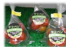
事業所でのトライアル販売

公益社団法人学校給食会及びパン・学校給食米飯協同組合と連携し、学校給食パンの塩分15%減塩化を行った。(H28.4から全公立小中学校(入善町を除く)で提供)