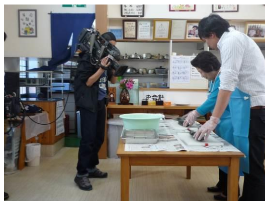
○県政番組での県内各地の食育実践を紹介