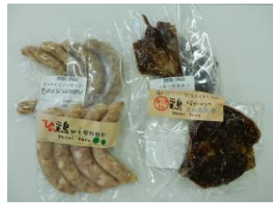
ワインナー 「ひね鶏 wiener」ほか (上市町・「有安井ファーム」)