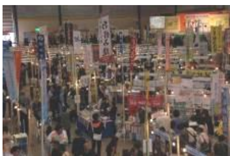
(秋の陣 富山テクノホール)