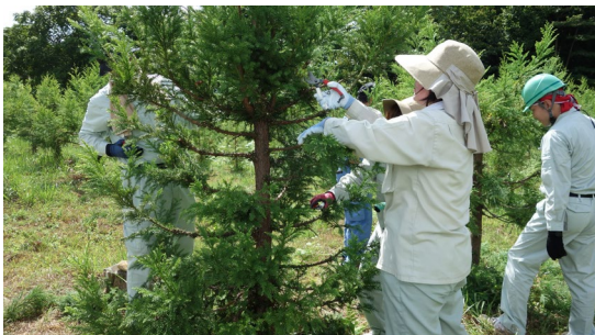
植栽した母樹の剪定

生育期間が短く、低コストで大量生産が可能となる挿し木苗生産に向け、県魚津採種園で採穂林整備のために植栽した母樹の剪定を行いました。