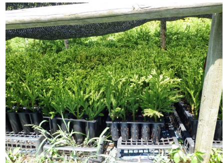
優良無花粉スギ「立山 森の輝き」のコンテナ苗の生産状況

森づくりプランに基づき、優良無花粉スギ「立山 森の輝き」の苗木を生産。また民間生産者に対し、コンテナ苗の生産指導をしました。