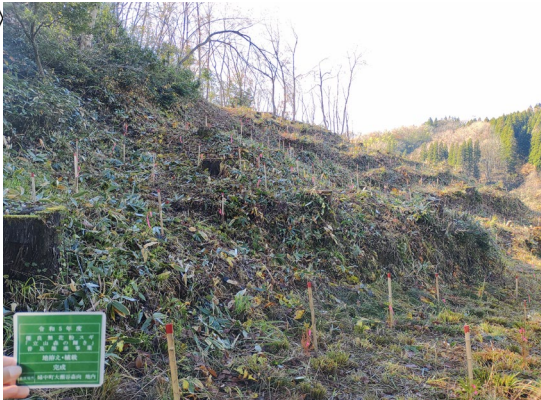
富山市大瀬谷森向地内