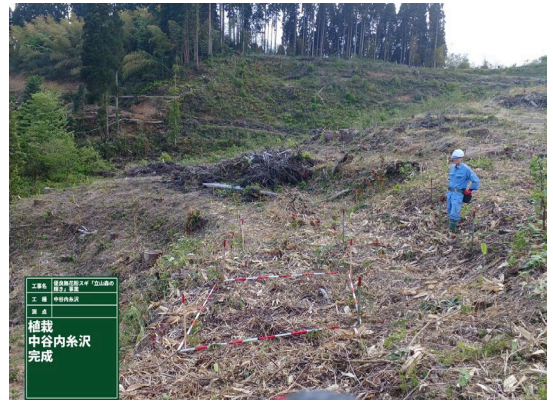
氷見市中谷内糸沢内地内