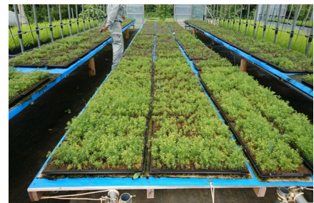
優良無花粉スギ「立山 森の輝き」のセル苗の生産状況

森づくりプランに基づき、優良無花粉スギ「立山 森の輝き」の苗木を生産。また民間生産者に対し、コンテナ苗のセル苗を生産・指導をしました。