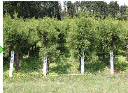
採穂林のイメージ