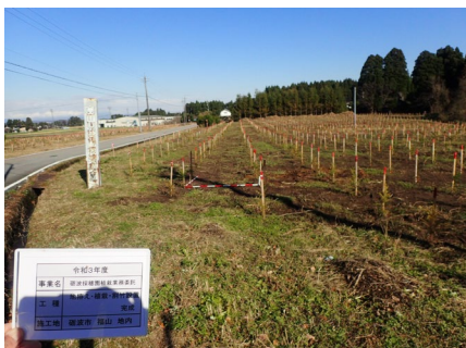
砺波採穂園で植栽

生育期間が短く、低コストで大量生産が可能となる挿し木苗生産に向け、県砺波採穂園で採穂林整備のための母樹の植栽（5,000本）を行いました。