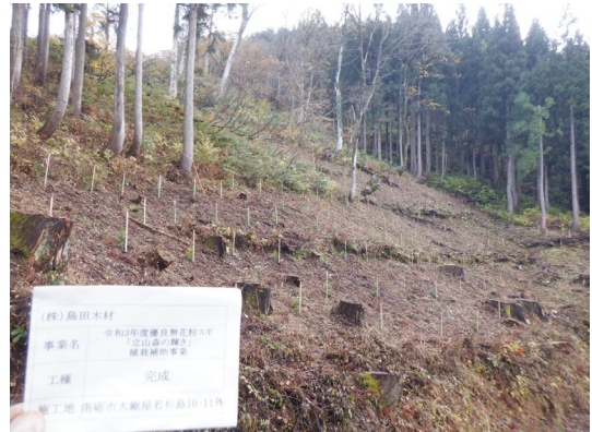
南砺市大鋸屋地内