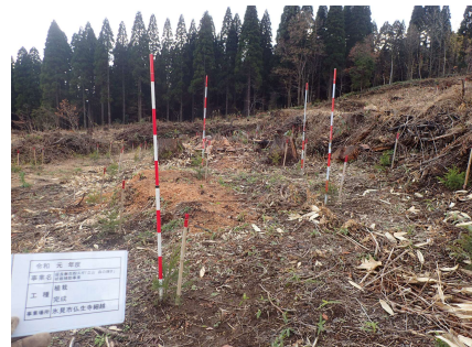
氷見市仏生寺Ⅰ 地内