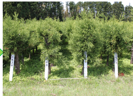
採穂林のイメージ