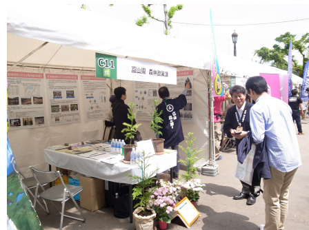
優良無花粉スギ「立山 森の輝き」を実物の苗とパネルを用いてPR

優良無花粉スギ「立山 森の輝き」を県外へ出荷することを視野に入れ、全国的緑化行事である「緑の感謝祭」の併催行事である「みどりとふれあうフェスティバル（東京都立日比谷公園）」に出展しました。