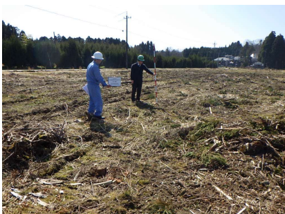
砺波採穂園を造成

生育期間が短く、低コストで大量生産が可能となる挿し木苗生産に向け、県砺波採穂園で採穂林植栽のための造成整備（0.80ha）を行いました。