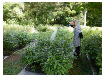
苗木育成状況 (灌水作業中)