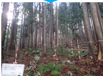
手入れが行き届かず、過密になった人工林を整理