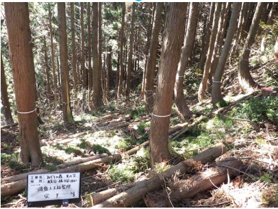
手入れが行き届かず、過密になった人工林を整理