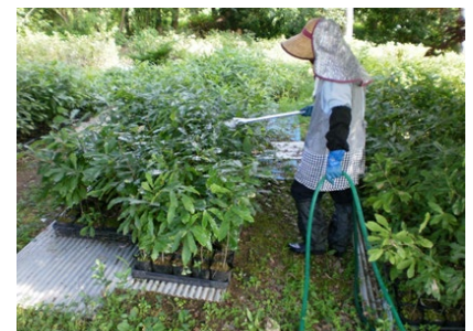
苗木育成状況 (灌水作業中)