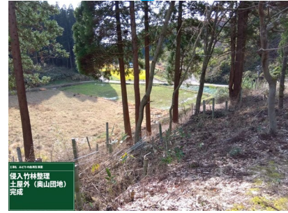
スギ人工林に拡大・侵入した竹林を整理