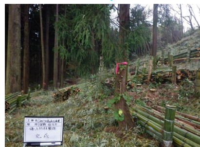
スギ人工林に拡大・侵入した竹林を整理