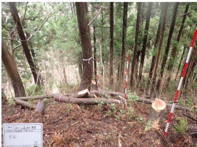
手入れが行き届かず、過密になった人工林を整理