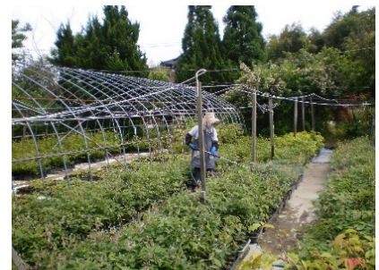
苗木育成状況 (灌水作業中)