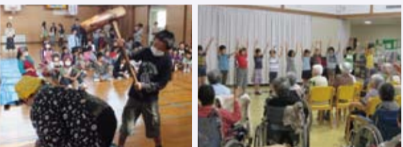
おばあちゃんと一緒に餅つき 常楽園のお年寄りの方との交流