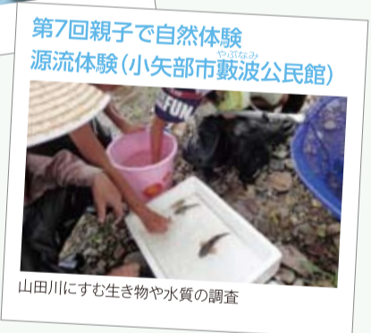
第7回親子で自然体験 源流体験(小矢部市敷波公民館) 山田川にすむ生き物や水質の調査

とやま公民館学遊ネット 公民館を中心としたイベントや講座、それぞれの公民館の活動報告などをインターネットで見ることができます。 http://www2.tkc.pref.toyama.jp/kouminkan/