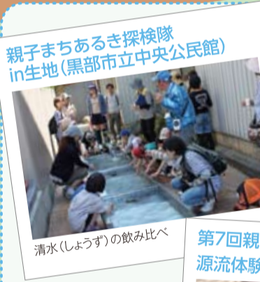
親子まちあるき探検隊 in生地(黒部市立中央公民館) 清水(しょうすい)の飲み比べ