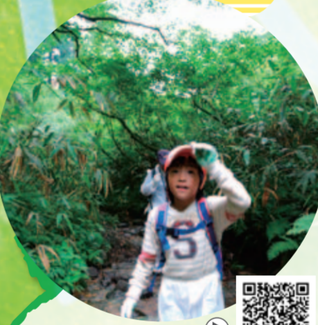
動物の鳴き声がするよ！

里山など身近な山を、家族で歩いてみましょう。木々のにおいや木漏れ日を感じ、草花を見たり、動物の巣や糞など生き物の痕跡を発見したり、子供たちと一緒に観察してみましょう。