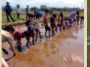
ボーイスカウト富山第19団 田植え体験

ボーイスカウト&ガールスカウトの自然体験 ボーイスカウト富山第19団では、ビーバー隊が田植えに挑戦しました。生まれて初めての泥んこに驚いていた子供たちも、みんなで力を合わせて無事終了！秋には、稲刈りをしておにぎりをつくる予定のこと。