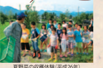
夏野菜の収穫体験(平成26年)