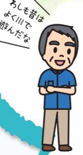
あしも書はよる川で遊んだら