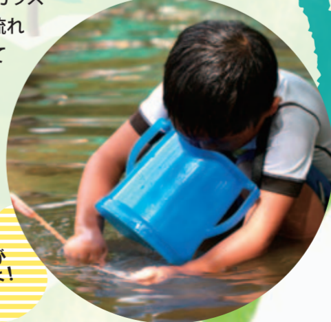
川の中がみえるよ！

箱めがね(水中観察用)や大きなガラスビンなどを使って川の中を観察し、流れに踊る藻や、水中の生き物を発見してみましょう。