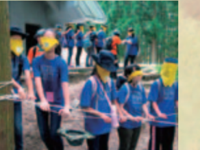
ガールスカウト富山県連盟 自隠しトレイル