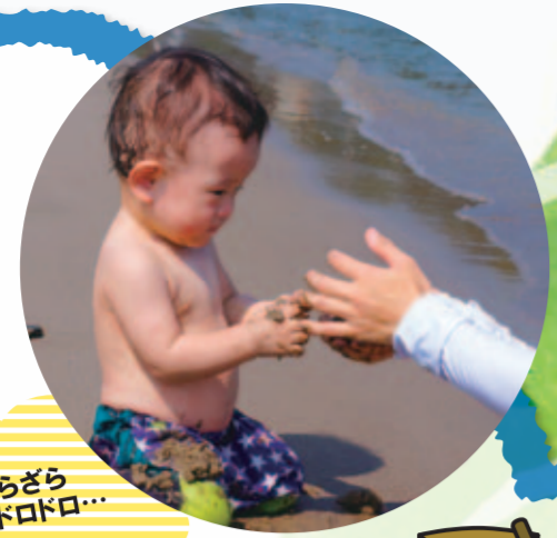
ざらざらドロドロ...