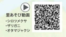
里あそび動画 ・シロツメクサ ・ザリガニ ・オタマジャクシ