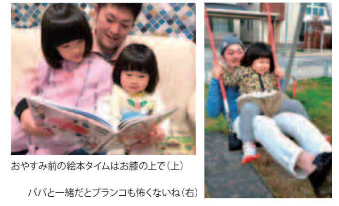
おやすみ前の絵本タイムはお膝の上で(上) パパと一緒にだとプランコも怖くないね(右)