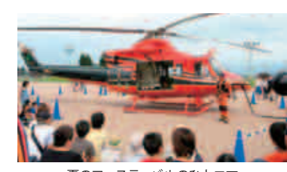
夏のフェスティバルのひとつ

消防防災ヘリコプターや様々な消防車両が参加する「防災フェスティバル」を開催します。当日は、消防ポンプ車や救急車の試乗や、消防防災ヘリコプターの訓練などを体験・見学できます。災害救助犬も参加します。 ●日時/平成30年2月25日(日) 10時~15時 ●場所/富山県広域消防防災センター(四季防災館) ●入場料/無料 その他、四季防災館では、災害を映像などで紹介しているほか、地震・煙・風雨災害・流水などを体験できるコーナーがあります。ぜひ、ご家族で防災について学んでみましょう。 お問い合わせ先 富山県広域消防防災センター(四季防災館)富山県総合体育館10001 TEL 076-429-9916