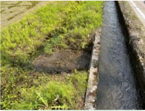
水路老朽化による漏水