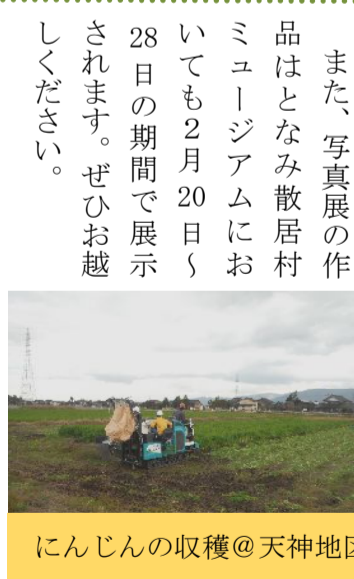
にんじんの収穫@天神地区

また、写真展の作品はとなみ散居村ミュージアムにおいても2月20日〜28日の期間で展示されます。ぜひお越しください。