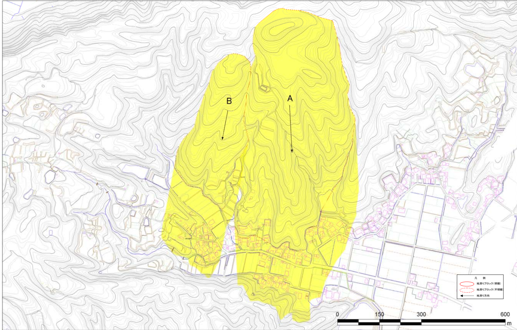
土砂災害警戒区域等の指定の公示に係る図書（その2）