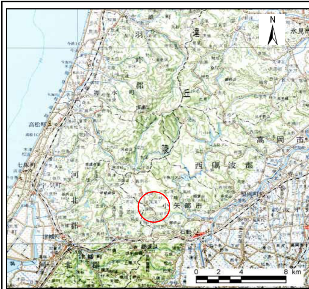
位置図 (S = 1:200,000)