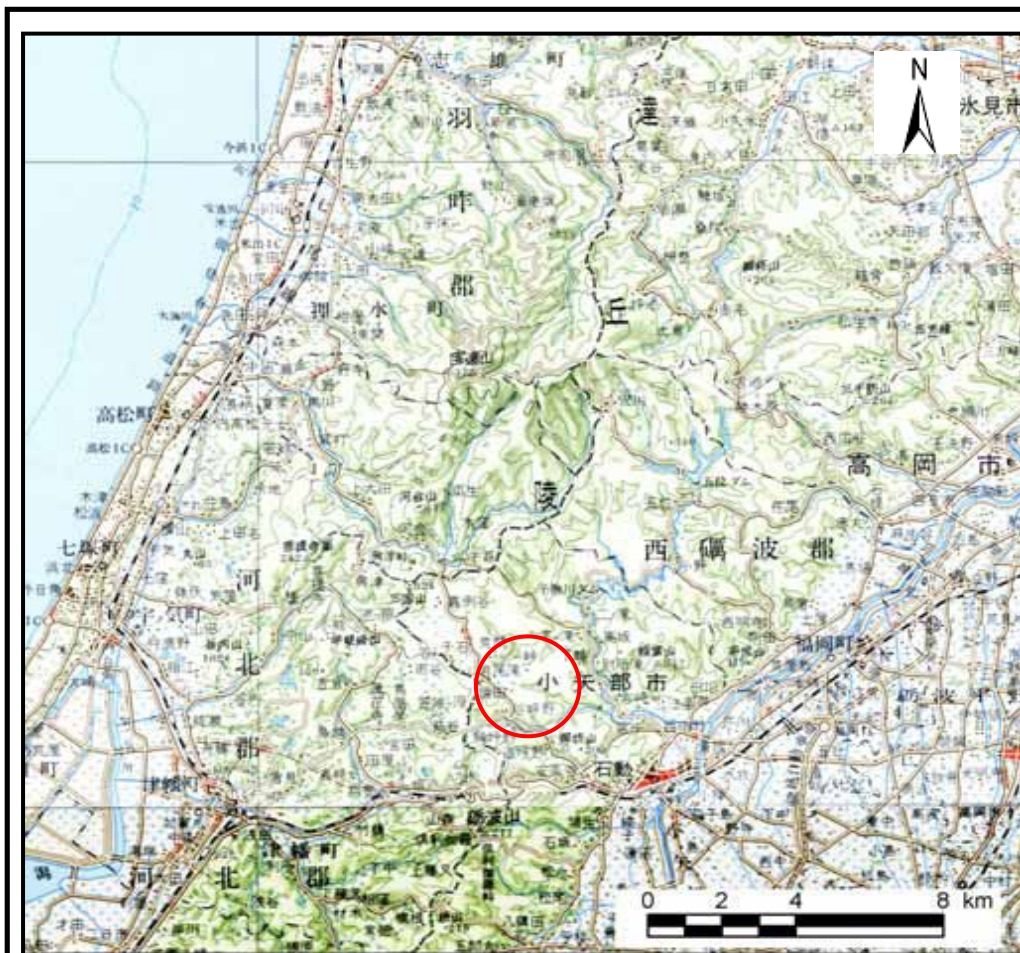
位置図 (S = 1:200,000)