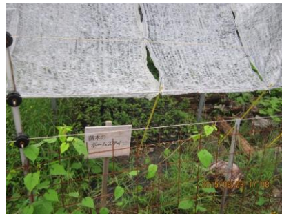
H27年8月23日、電気柵と太陽の直射に保護されています。