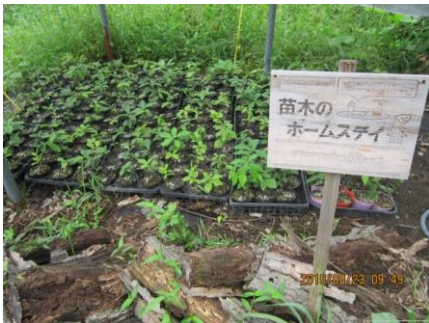
H27年 7月、別所部落に移動

昨年〔26年〕12月配布されたどんぐりの種が27年7月には場所を山間部に移動し、3芽のポットを1芽ごとに株分けし、電気柵と寒冷紗で保護した。