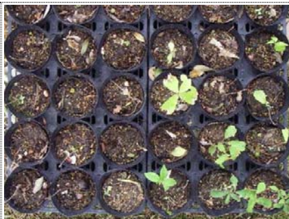
コナラ ゆっくり成長