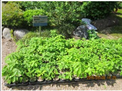
5 月にはこのように青々としています。

写真のように青々とした若葉が茂っていると、根元が窮屈になるのではないかと心配です。早く植樹祭の会場でのびのびと手足を伸ばしたがついていきます。よろしく！