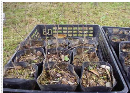
クリ ボランティア交流会に 7 株提供