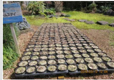
H28 年 3 月には枯れ木のような状態でした。

H28 年の若葉が出始めたこの季節の苗木の状況を報告します。元気に青葉が茂り始めました。