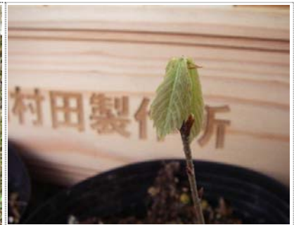
ボランティア交流会に提供したクリ