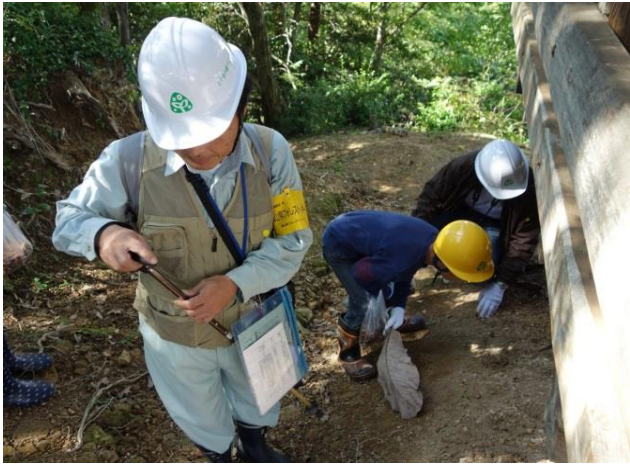
ドングリあるかな？

《 写 真 》 (写真を3枚以上ご提供いただける場合は、裏面(別紙)をご利用ください。)