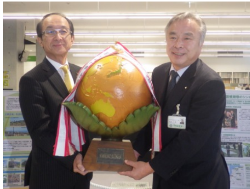
木製地球儀手渡しの様子（左が堀内市長）