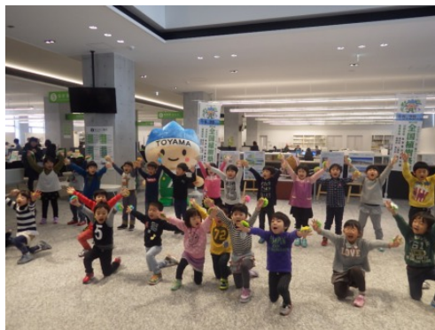
メッセージと歌、踊りの披露