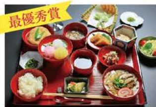
農家レストラン 大門株式会社

学校給食・社員食堂、外食・弁当等において、生産者との交流促進等の取組みを伴った地場産農林水産物を食材として活用したメニューを募集し、優れたものを表彰しています。