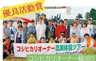
農事組合法人 頼成宮農組合/砺波市

地域と連携・協力して地産地消に取り組み、優良活動と認められた企業・団体を「優良活動賞」として表彰しています。