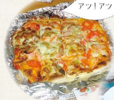
できあがったピザ!