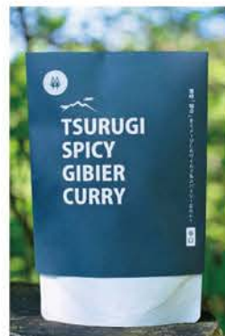
▲メデルケのイノシシカレー

イベント等でのPR、ジビエ料理の普及、低価格商品の開発に取り組むほか、獣肉処理施設の整備にも支援しています。