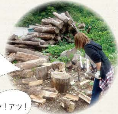
ピザを焼くにも薪割りから

毎年5月に行っている「山菜採りツアー」は大学の課外プログラムで利賀村に訪れた大学生達に好評です。学生達と一緒に採った山菜は調理して郷土料理として振る舞います。その他に地元野菜である、トマト、なす、みょうが、きゅうり、かぼちゃなども加わります。また、料理だけでなく、ピザを作る時に、ピザ釜用の薪を自分たちで薪割りするなど農村ならではの体験が満載です。