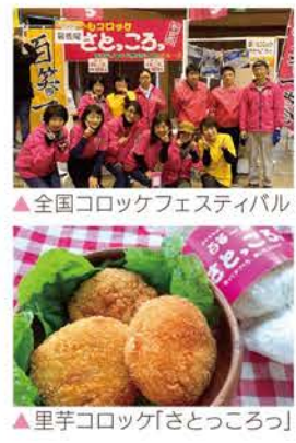
▲全国コロツケフェスティバル ▲里芋コロツケ「さところ」