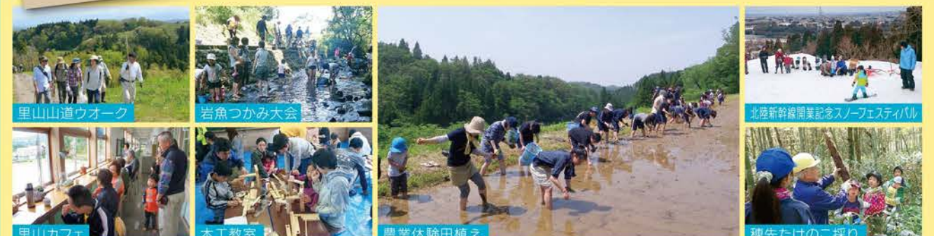
里山山道ウォーク