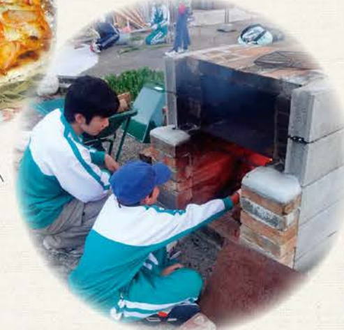
割った薪はピザ釜へ