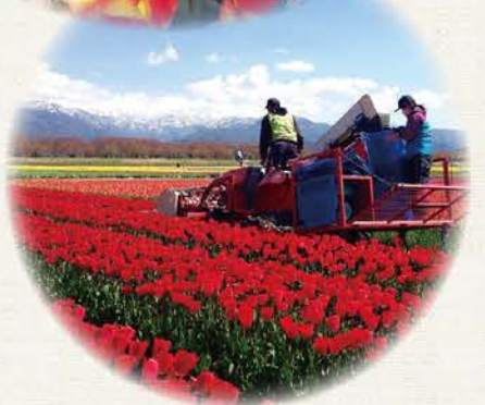
農業が営まれ守り育まれる風景

来た幼児や観光客も手伝って下さいました。前屈みで広い畑を歩きながら花を摘み取る重労働を体験し、少しでも農家の苦労が分かると、春の四重奏の風景がより輝いて見えます。絶景を前に(蛙(あせ)に腰掛けおしゃべりしながら)いたたくお茶もまた贅沢で、貴重な体験が出来たと参加者は喜んでおられました。 摘み取られた花びらは、桜の根元に撒かれて肥料となり桜の幹を大きく育てます。舟川べりの見事な桜トンネルとチューリップが、美しい循環でつながっています。