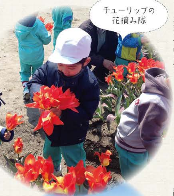
チューリップの花摘み隊

J Aみな穂青壮年部主催の「田んぼアート田植え」が、毎年5月下旬に開催され、年々参加者が増えています。田んぼのキャンバスに数種類の古代米を手植えて絵を描き、稲の成長とともに表情の変化を楽しめます。収穫したお米は、「田んぼアート米」として販売され、おいしくいただくことができます。平成28年7月には、舟川の