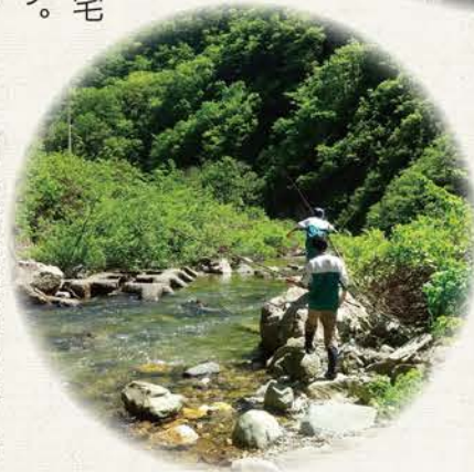
草刈りの時に見つけたミミズで釣りをしました

5月の終わり頃から、休耕田を活用した農業活動を行います。これまでに古代米、大豆、赤かぶの栽培に取り組んできました。修学旅行で訪れた都市部の中学生達に楽しみながら草刈り作業を体験してもらっています。地元住民の作業の軽減にもつながっています。