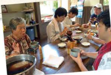
▲バタバタ茶 伝承館での交流

昨年度に引き続き、二年目の開催となる蛭谷地区。今年度は地域の現状や昨年度の成果を踏まえ『空き家及び耕作放棄地等を活用した都市農村交流の仕組みづくりの検討』をテーマとしました。 成果発表では、空き家を利用した和紙づくり体験や墨絵の展示会を開催することで空き家の老朽化を防止するなどの提案がありました。 今回のインターンシップでは朝日町へ移住したいと宣言する学生が現れるなど、課題解決提案以外の成果も見受けられました。今後はこのインターンシップの成果をいかに活かして地域を盛り上げていくかが課題となります。