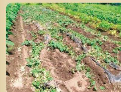
▲荒らされた農作物