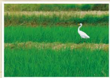
「グリーンカーペットを歩く」 青柳 愛莉 (射水市)