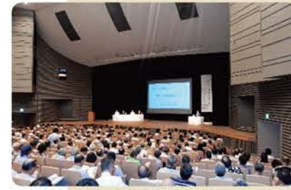
▲パネルディスカッションの様子