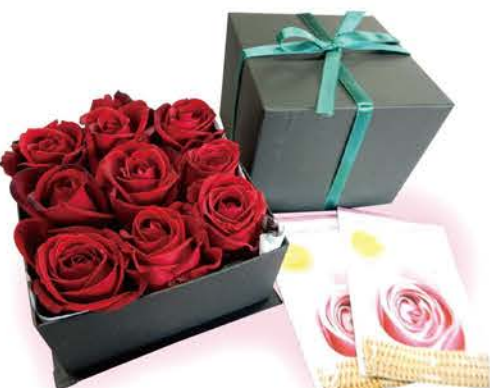
9輪のギフトボックス(小)2,700円税込 16輪のギフトボックス(大)4,320円税込 (バラの香りの入浴剤付き)

県内バラ切り花の60%以上が生産されている小矢部市の田中国芸では、水耕栽培により、一輪一輪に真心を込めて高品質のバラを栽培しています。 加工部「メルヘン工房」は、安原みさとさんを中心に、花束やバラの加工品のほか、アレンジメント教室も開催するなど幅広く活動されています。中でも、今最も人気が高いのが、お風呂用のバラの生花「バラ風呂」商品です。 道の駅「メルヘンおやべ」の足湯に、りんごやバラなどを浮かべる企画でお客さんの楽しんでいる姿を見て、頑張る女性の自分への褒美としての需要があるのではないかと考え、商品開発に取り組みました。