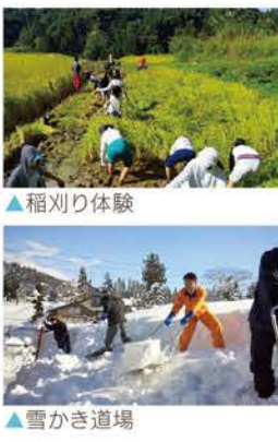
▲稲刈り体験 ▲雪かき道場