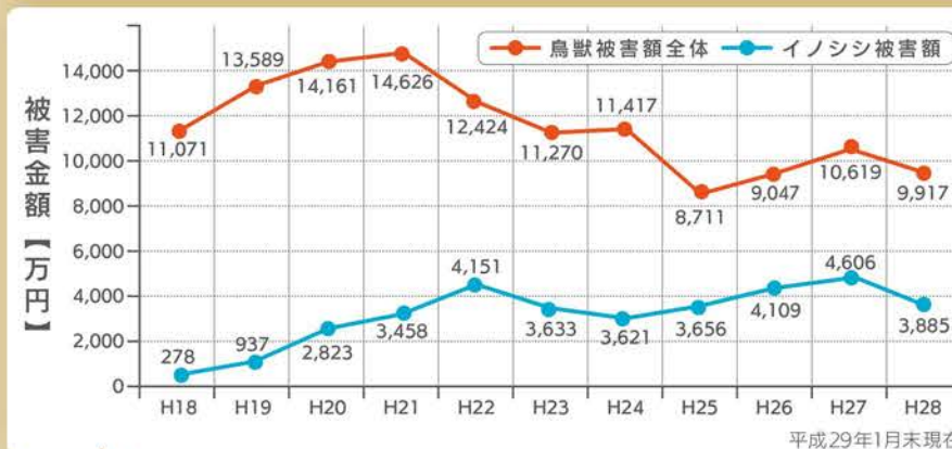
イノシシによる農作物の被害額の推移

県では、平成29年度に、被害実態や防止柵整備状況を地理的に把握し、被害削減目標や防止柵・捕獲檻の計画的な整備などを盛り込んだ、「イノシシ被害防止対策方針」を策定するとともに、地域実践リーダーの育成を進めます。