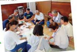
▲住民聞き取り調査