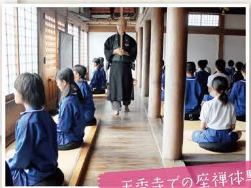
天香寺での座禅体験