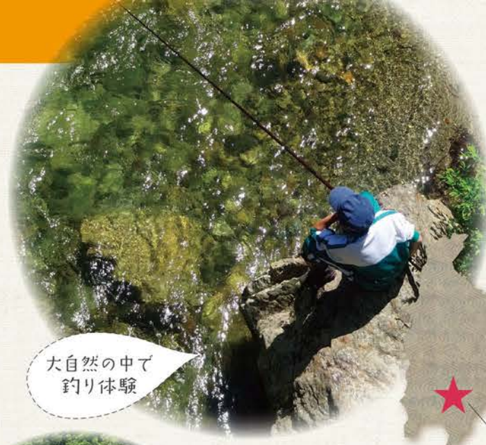
大自然の中で釣り体験