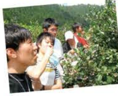
▲ブルーベリー園見学

岐阜県境に位置し富山市中心地から車で一時間以上かかる八尾町大長谷地区は、点在する地域資源を活用し、年間を通じた交流人口を確保していきたいとの地域の思いから、「定常的な交流人口の確保に向けた地域資源の整理及びグリーン・ツーリズムへの活用」をテーマとしました。 成果発表では、人を呼び込むための地域マップ作成や白木峰をベースとした交流プランなどのアイデアが出されました。 今後は、交流人口の確保に向けて今回のインターンシップでの提案をきっかけとして、まずは地域自ら考え、実現可能なことから取り組むことで地域活性化につながることを期待されます。