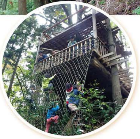
▲ツリーデッキ・アスレチック

里山は自然のおもちゃ箱 小羽地区もまた少子高齢化、人口減少の波にさらされています。「NPO法人こば」では、小羽地区の現状を変えようと、そば打ち教室や自然体験、農業体験、森の整備活動やツリーデッキ建設、アスレチック設置などを企画し、訪れた親子連れはとも楽しんでおられました。 これによって、小羽地区外の人々との交流人口は大幅に増え、移住する人たちも少しずつ増えています。今後は空き家バンクなどにも取り組んでいく予定です。 でも一番大切なことは、この地域で実際に暮らしている方々が、どれ