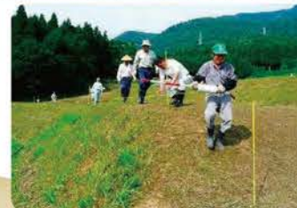
▲侵入防止柵の設置