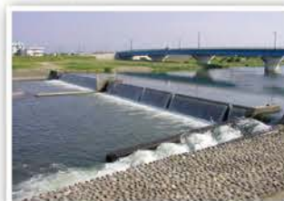
▲三日市頭首工河川左岸より