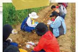
▲住民聞き取り調査