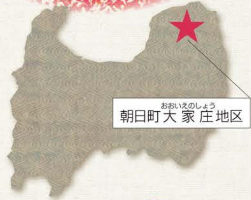
おおいえのしょう 朝日町大家庄地区