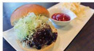
◀ジビエハンバーガー