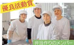
愛彩グループ/高岡市