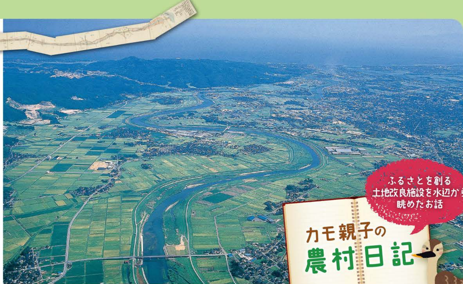
▲小矢部川下流左岸地域航空写真

用水見学会では、地域の小学校3校の4年生を対象として、用水路の主要施設や地域用水機能施設、用水の歴史施設を半日かけてまわります。今年度は6月に2回開催されました。