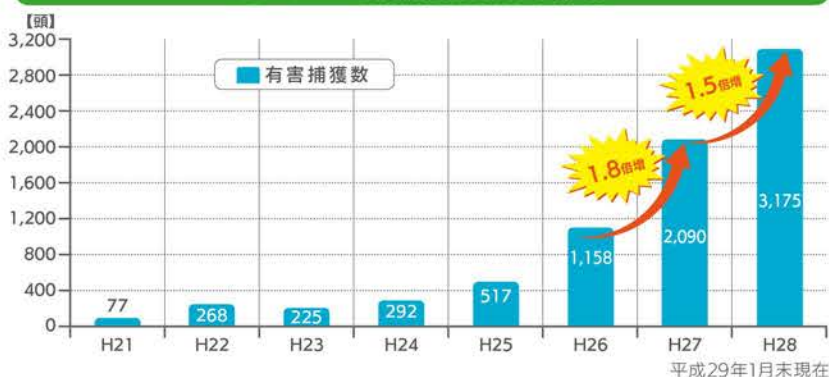
イノシシの捕獲頭数の推移