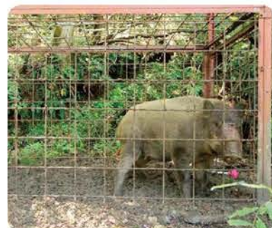
▲捕獲したイノシシ