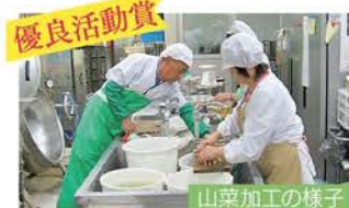
農事組合法人 八尾農林産物加工組合/富山市

大門素麺をはじめ、「ゆべし」「よごし」「具入り丸揚げ」「根菜いとこ煮」など、砺波平野での地産地消の健康的な郷土料理。