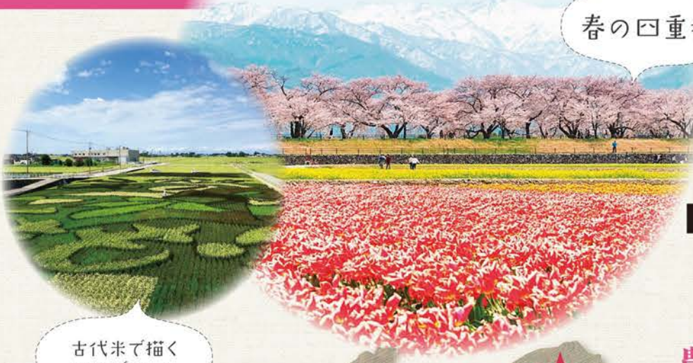
古代米で描く 田んぼアート