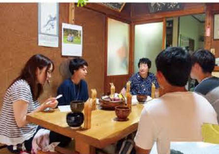
▲住民聞き取り調査