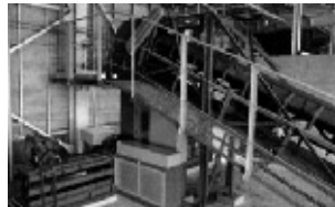
プラスチック圧縮機