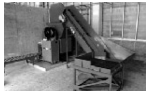
ペットボトル減容機