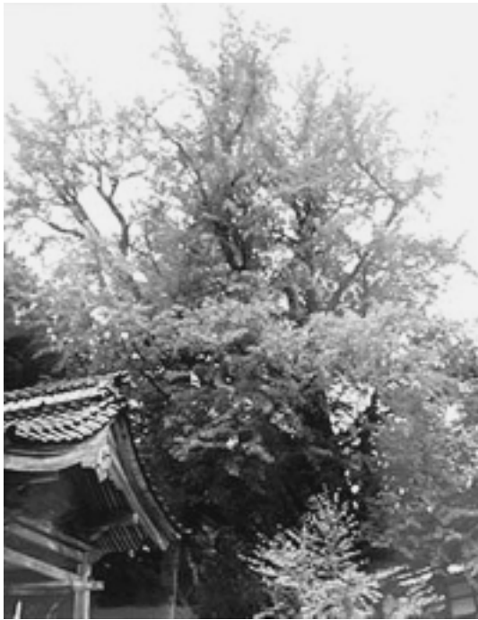
しろいだに 「白井谷のイチョウ」

樹幹周囲4.7m、樹高18mで樹齢約400年に及び、イチョウの実は約360 に及びます。葉は初雪で全て落葉するので、尊光寺のイチョウの葉が散ると根雪になるといわれ、収穫や冬支度を早める目安となっています。