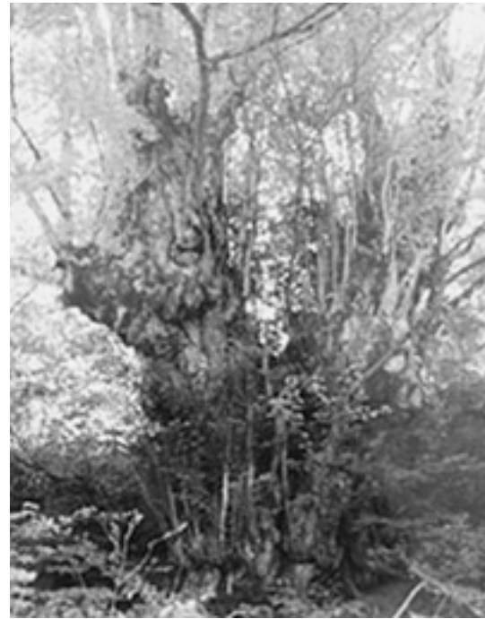
いぶね 「居舟の大かつら」

樹幹周囲4.7m、樹高18mで樹齢約400年に及び、イチョウの実は約360 に及びます。葉は初雪で全て落葉するので、尊光寺のイチョウの葉が散ると根雪になるといわれ、収穫や冬支度を早める目安となっています。