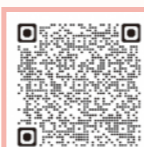
▲親を学び伝える学習プログラム55の事例はこちら