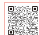
▲家庭教育講座動画はこちら