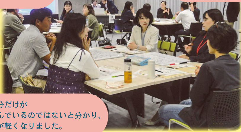
(令和6年6月黒部会場)