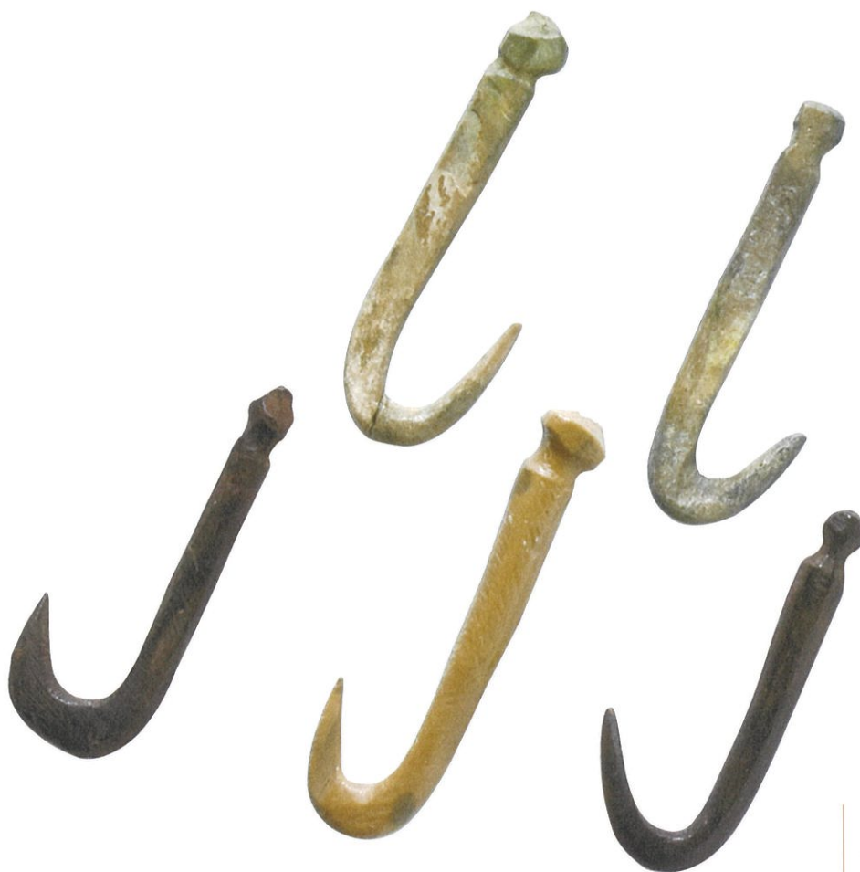
小竹貝塚出土品(富山市呉羽) 《単式釣針》

小竹貝塚から出土した縄文時代前期の釣針です。動物の骨や角を利用して作られています。