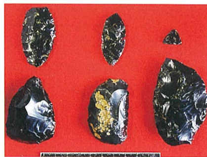
立美遺跡出土の黒曜岩製石器

石器を持つ移動がもっとよくなる遺跡があります。南砺市立野ヶ原遺跡群の立美遺跡です。立美遺跡の発掘調査では約1千点の石器が出土していますが、その90%近くが良質な黒曜岩です。黒曜岩は火山ガラスで、火山列島である日本列島の各地に産出しますが、その成分がそれぞれ微妙に異なっており、蛍光X線分析で産地を推定することができるようになりました。調査が行われていた時点では長野県の和田峠の黒曜岩と考えていましたが、蛍光X線分析では青森県の深浦のものと判定されました。深浦から立美遺跡まで直線距離で600km以上、旧石器時代の移動距離としては長すぎると思いまし