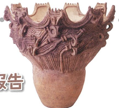
重要文化財! 境A遺跡出土縄文土器(中期中葉)