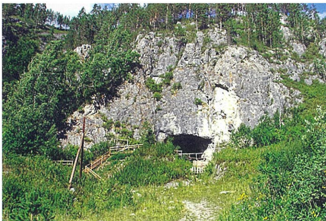
シベリア・デニソワ洞窟