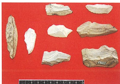
瀬戸内系石器群(直坂II遺跡)