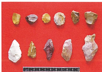
立野ヶ原石器群(西原C遺跡)

大陸の遺跡のように狩猟で獲られた大量の動物骨が出てくれば具体的な食料や狩猟の実態も判明するのですが、日本列島のほとんどの旧石器時代の遺跡からは石器しか出土しません。研究手段が限られていますが、旧石器時代の石器の石材を調べるという考古学的手法で当時のヒトの行動範囲を明らかにすることができます。また、石器の形態や製作技術の比較研究で集団の広がりや集団間の関係にも言及することができます。まだまだ、考古学者の存在価値は衰えていないと自負しています。