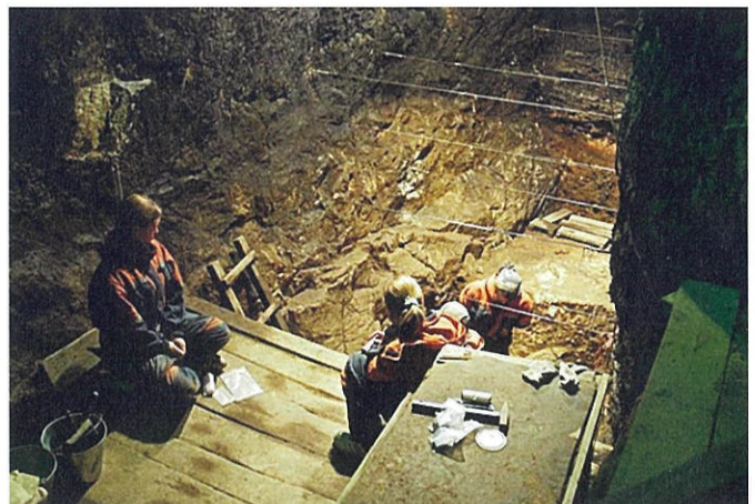
デニソワ洞窟の発掘風景