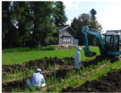
小出城跡 試掘溝掘削状況

富山市の北東部、常願寺川下流の扇状地に位置する戦国時代の城館跡です。織田信長に付く佐々成政と越後上杉勢との攻防の場となったことで知られます。『信長公記』等の文献資料に出てくる「小出城の戦い」は、天正9(1581)年、信長の馬揃えのため織田勢が京都に集まった際に上杉景勝が小出城を包囲しますが、急を知った佐々成政が織田勢の武将と共に取って返し、景勝を撤退させた出来事です。翌10年の本能寺の変後、景勝は再度小出城を奪います。天正11年に佐々成政が魚津城