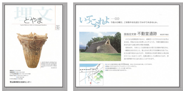
第71号 表紙は境A遺跡の土器(重文) 巻末「行ってこれよ」(第1回は不動堂遺跡)

平成12年度(第71号)からカラー印刷となり現在の形に。巻末におすすめの県内遺跡を紹介する「行ってこれよ」の連載がスタート!