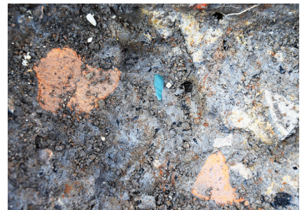
水橋小出遺跡 碧玉出土状況

小出城跡の東に位置する弥生時代から近世に至る集落跡です。南北約800m、東西500mの広大な範囲が遺跡とされていますが、集落の中心がどこにあるのかはわかっていませんでした。今回の調査で、アシやヨシが生い茂った沼や湿地が広がる景観が復元でき、所々にある微高地上で人々が暮らしていた様子が判ってきました。微高地のひとつでは弥生時代中期の竪穴住居数棟と住居を取り巻く周溝が見つかり、埋土から弥生土器が潰れて壊れた状態で多数出土しました。土器の破片に混じって、翡翠や碧玉の剥片、砥石も見つかりました。碧玉は鮮やかな緑色の石で、管玉の材料となります。当時、集落内で勾玉や管玉などの玉作りをしていたのかもしれない。