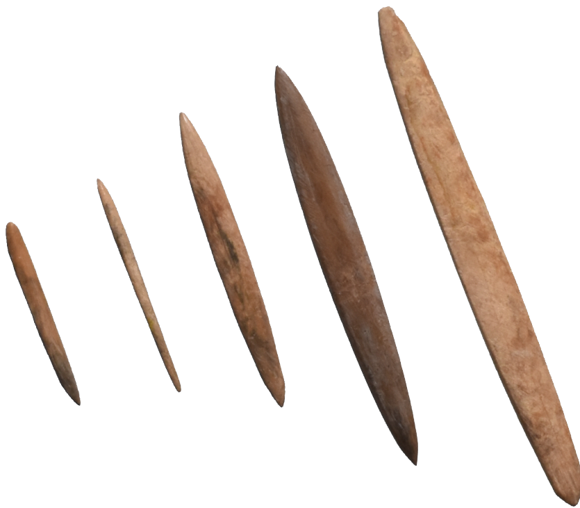
小竹貝塚出土品（富山市呉羽） 《刺突具》

小竹貝塚からは、動物の骨角を素材とした様々な骨角器が1,683点も出土していますが、その中でも刺突具が最も多く、907点も出土しています。