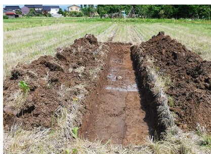
小出城跡 堀検出状況

今回の調査で、城の中心部と考えられる小出神社周辺から、堀と思われる直線的で深い遺構を複数確認しました。城館本体は見つかりませんでしたが、神社敷地の辺りに存在した可能性がますます高まりました。一方で遺跡縁辺部では自然河川や湿地の広がりが見られました。小出城跡は南北西の三方を中小河川で囲まれた微高地に立地しており、水運や交通の要衝であるとともに、敵の襲来に備えた天然の要塞であったことが明らかとなりました。