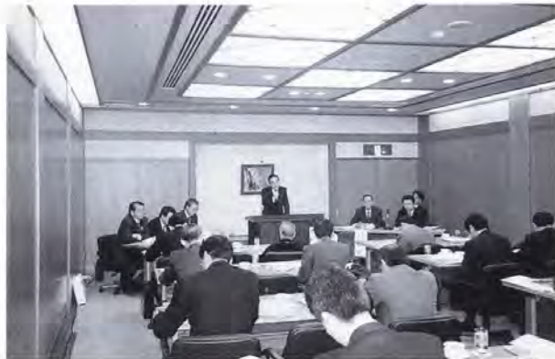
▲昨年、高山市で開催されたエアポートセールス会場風景