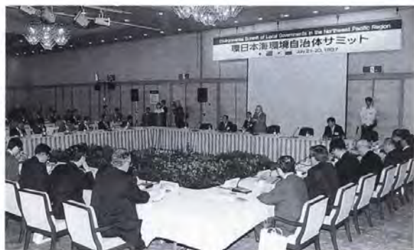
▲昨年7月に富山で開催された環日本海環境自治体サミット

また、今年十月には、日本、中国、韓国、ロシア、モンゴルの自治体に参加する北東アジア地域自治体会議'98が富山県で開催され、環境協力をはじめ、経済交流、学術文化交流などが主要な議題として協議されることになっています。