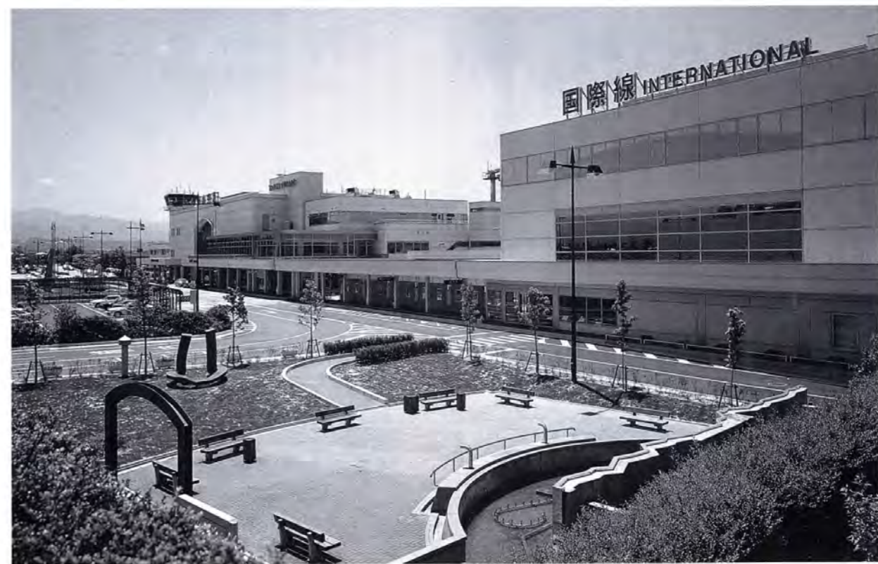
▲環日本海交流の拠点空港として発展する富山空港