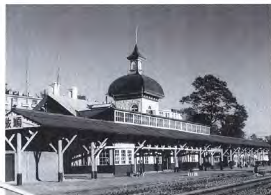
▲異国情緒あふれる懐かしい街(旅順駅)