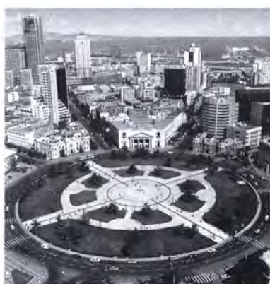
▲北方の真珠、大連の中心街

また、遼東半島の南端に位置する美しい港町であることから「北方の真珠」ともいわれ、アカシア並木や西洋風の建物が醸し出す独特の雰囲気は訪れる人を魅了してやみません。毎年五月に行われるアカシア祭りや八月の国際ファッション祭りには多くの観光客が訪れます。