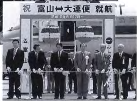
祝 富山⇄大連便 就航