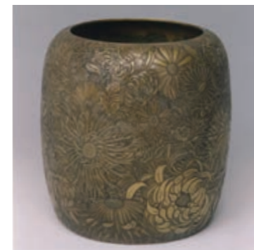
忠正が注文した2代北岳横山弥左衛門孝純作「菊花文飾壺」(個人蔵、東京国立近代美術館工芸館寄託、国登録美術品)

1905(明治38)年に帰国した忠正は、印象派絵画のコレクションを持ち帰り、自分の手で西洋近代美術館を造ろうと計画していましたが、果たせないまま亡くなりました。ポール・ルヌアールの素描作品だけは帝室博物館(現東京国立博物館)に寄贈されましたが、残りの西洋画の価値は理解されることなく、1913(大正2)年にアメリカで散逸してしまいました。