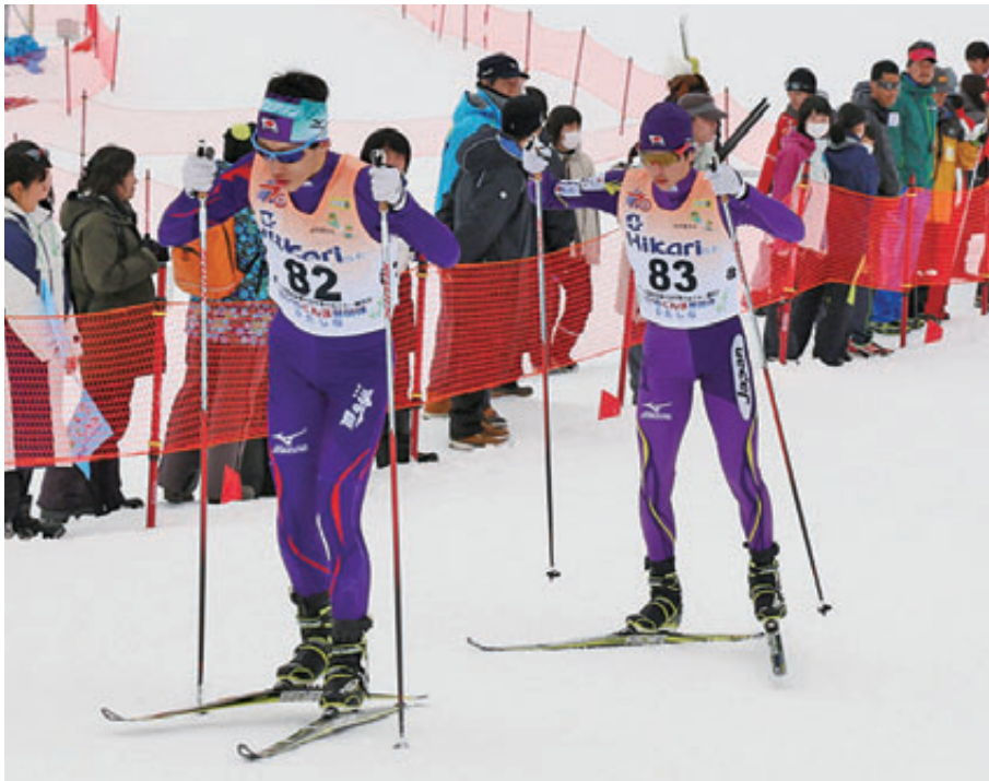
クロスカントリー