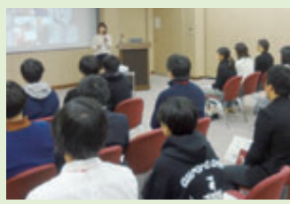
教員UIJターンセミナー

質の高い教育を提供するには、教員が児童・生徒と向き合う時間を確保することが重要であることから、スクールサポート・スタッフや部活動指導員など、外部人材の配置や教員の確保にも力を入れています。 若手教員による県内外の大学生等への仕事紹介、教員を目指す方向けの教員養成講座「TOYAMAていーチャーズ」カレッジや東京などでの「教員UIJターンセミナー」の開催等、富山県の未来を支える教員志望者をサポートしています。