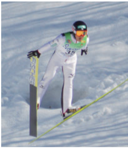
スペシャルジャンプ

ジャンプ競技とクロスカントリー競技を合わせて勝敗を争う競技です。最初にジャンプが行われ、その得点をタイム差に換算し、クロスカントリーのスタート順が決まります。