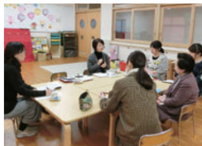
幼児教育アドバイザーによる訪問研修

子どもたちの人格形成に大切な幼児期の教育を充実するため、昨年4月、「幼児教育センター」を設置しました。子どもたちの、目標に向かってがんばる力や協調性などを育成するため、幼児教育の内容や指導方法の検討を進めるとともに、幼児教育アドバイザーが幼稚園や保育所、認定子ども園を訪問し、子どもたちの姿を通して保育者の接し方を学び研修を行っています。