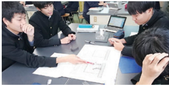
タブレットを活用した授業

情報通信技術のさらなる進展が見込まれることから、これまでも、県立学校にタブレット端末等ICT機器の配置や無線LAN環境の整備を進めてきました。昨年度までに27校で整備しており、今年度15校、来年度には残る14校で整備することとしています。 さらに、小中学校の新学習指導要領においても情報活用能力の育成が重要とされ、ICTを適切に活用した学習活動の充実が求められています。このため、専門家を招いての講演や、先進地の視察など、ICTを活用した授業改善に向けた各市町村の取り組みを支援することで、教育の場での効果的な活用を全県下に広めています。