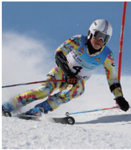
ジャイアントスラローム