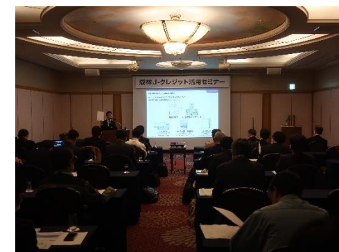
森林J-クレジット活用セミナー