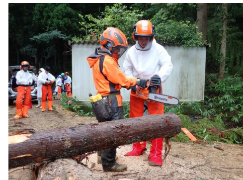
高校生や大学生等を対象とした林業体験の実施