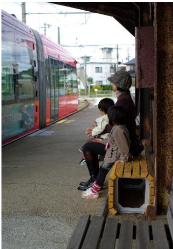
駅の待合室などに県産材ベンチを設置しました。