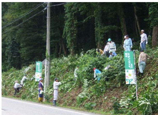
里山再生モデル林での森林整備開始式では地域住民等150名が里山林の整備に汗を流しました。