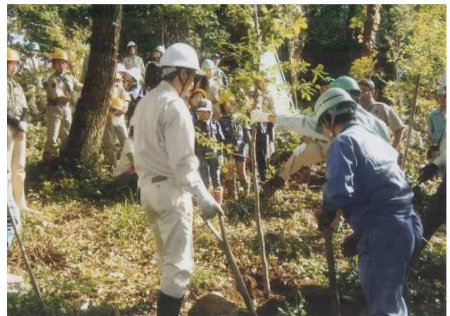
被害林の整備や森林の大切さについて学ぶ森林教室を開催されました。 (財)オイスカ 富山県支部)