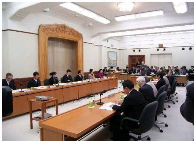
富山県水と緑の森づくり会議で議長（石井知事）があいさつ。