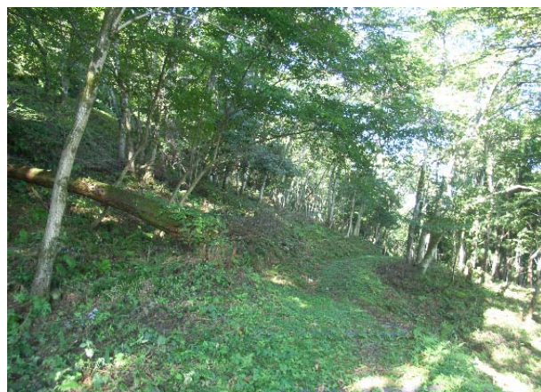
森林整備の実施により明るく見通しの良い里山林によみがえりました。