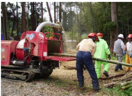
伐採木竹を処理するチップパーを貸し出しています。

登録団体が活動時に掲げる「のぼり旗」や、店舗店頭を設置する「ミニ旗」、企業の森づくりのPRパンフレットの作成・配布 など