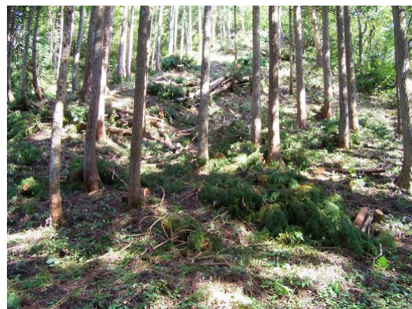
過密人工林を伐採し、林内に日光が射し込むようにすることで、広葉樹が発生し成長しやすい環境を整えました。