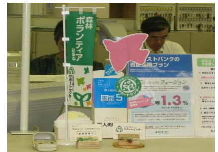
ミニ旗を作成し、店舗店頭を設置しPR活動を行ないました。