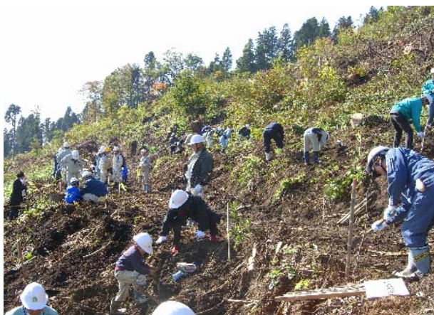
風雪被害を受けた倒木や折損木を整理した跡地で「上下流連携植樹の集い」を開催し、コナラやサクラなどの広葉樹の植樹活動を行ないました。