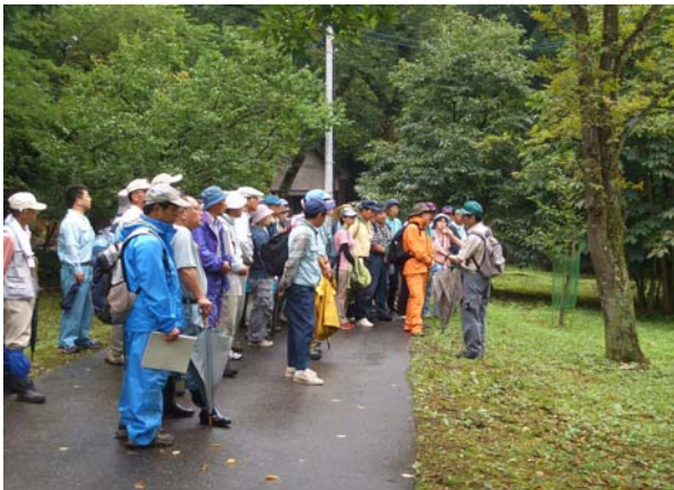
フォレストリーダーの養成講座では、座学だけではなく現地実習も実施しました。