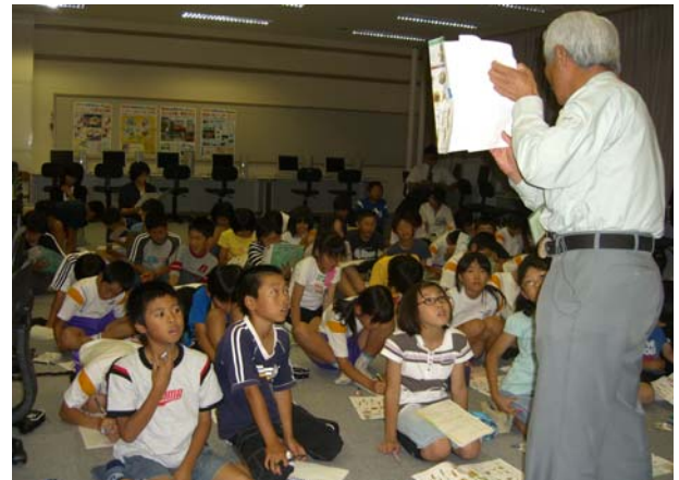
「森の寺子屋」では、小学校などからの要請を受け、フォレストリーダーが出向いて講義などを行っています。