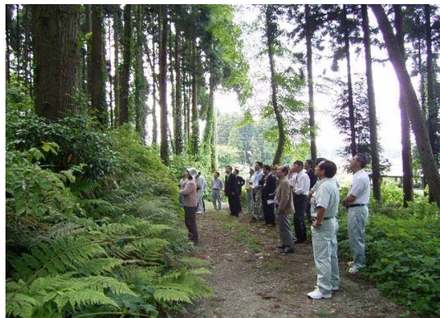
森林審議会森づくり部会が里山再生整備事業の実施予定地を現地調査しました。