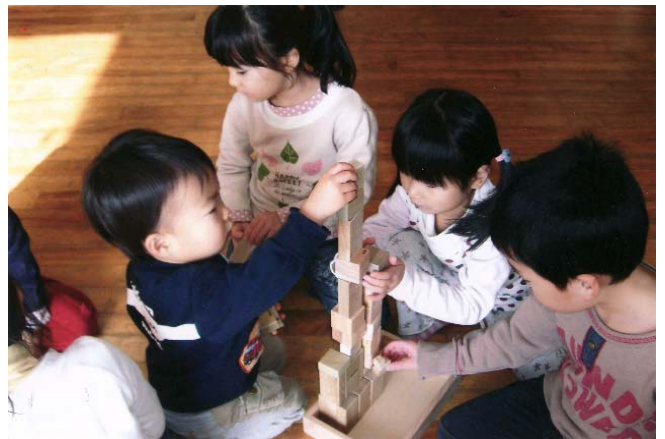
県下全ての幼稚園、保育所等に県産材の積木を配布しました。