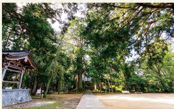
【所有者・管理者】 巖照寺