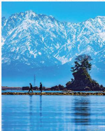
雨晴海岸「海辺の散歩」