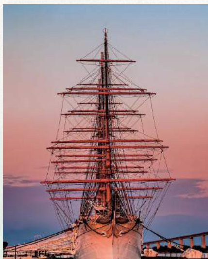
夕暮れにたたずむ貴婦人