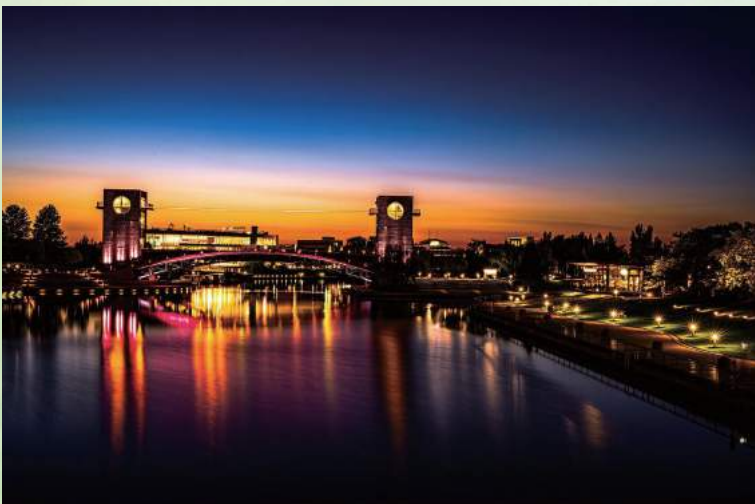
素敵だね、富山の夕暮れ