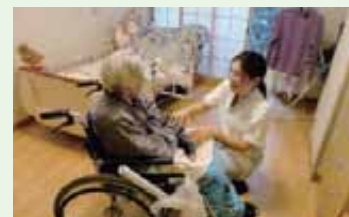
福祉・介護の職場で活躍する「介護のがんばりすた」