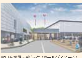
富山産業展示館(テクノホール)(イメージ)