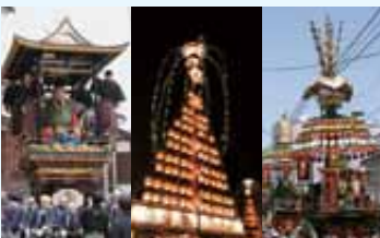
ユネスコ無形文化遺産に登録