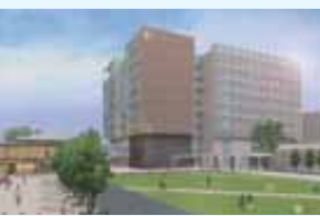
県立大学新棟(イメージ)