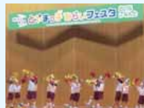
とやまっ子みらいフェスタ2016