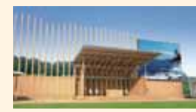
全国植樹祭 お野立所(イメージ)