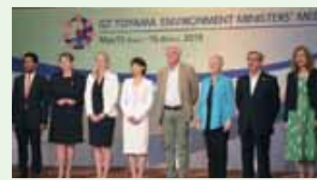
G7富山環境大臣会合