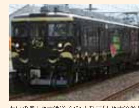
あいの風とやま鉄道イベント列車「とやま絵巻」