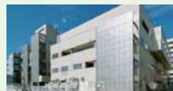
県立中央病院の先端医療棟