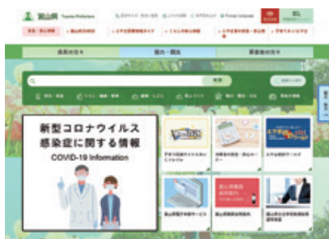
PC版 県民の方々向けトップページ