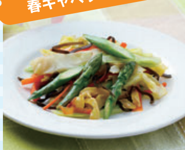
<協力> 砺波市食生活改善推進員協議会

アスパラガス …… 3本 塩昆布 …… 7g キャベツ …… 150g オリーブ油 …… 大さじ1 にんじん …… 30g