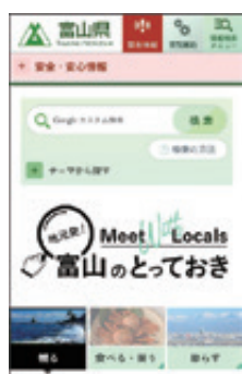
スマートフォン版 魅力・観光まとめページ